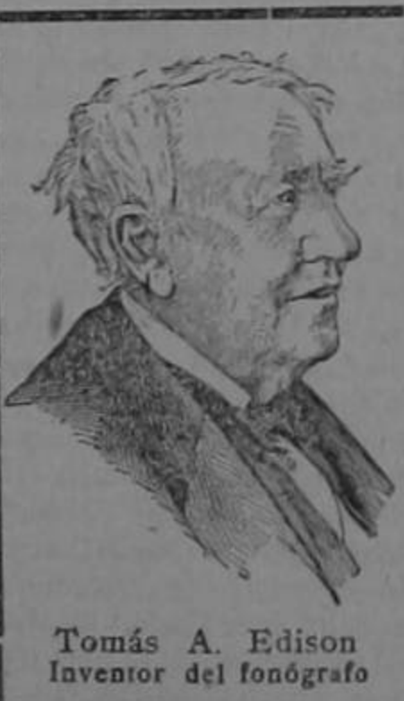
Tomás A. Edison Inventor del fonógrafo

El Hierro Nuxado no es un curallotodo. Se recomienda solamente para dar nueva vida a la sangre y al sistema nervioso; y un par de semanas bastarán para demostrar el bien que puede hacer. Hoy no será demasiado temprano para empezar. Todas las buenas farmacias lo venden.