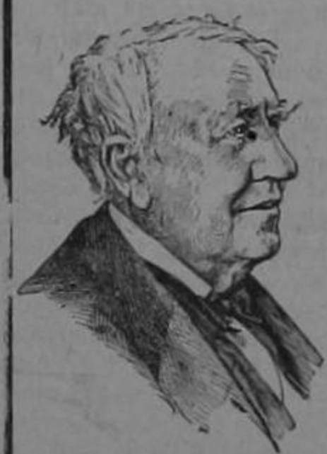
Tomás A. Edison inventor del fonógrafo