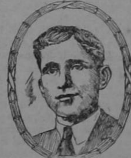
Sr. Pedraza (de la fotografía)

Las enfermedades de los riñones son la causa de tantas otras dolencias que es prudente tomar las Píldoras De Witt así que se presente el primer síntoma de ellas.