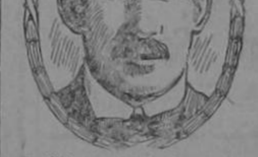
Sr. Gittens. (de la fotografía).

El dolor de espalda es generalmente un indicio de que hay algo de malo en los riñones, y los terribles dolores angustiosos son causados por el paso por riñones débiles ó inactivos de cristales de ácido úrico.