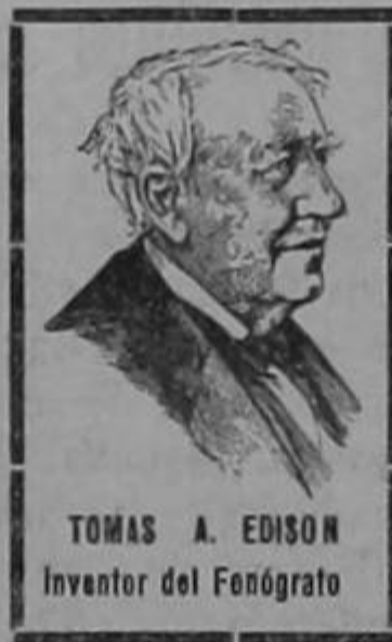
TOMAS A. EDISON Inventor del Fonógrafo