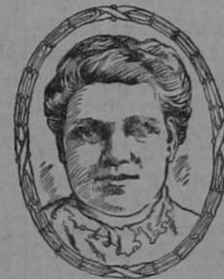
Sra. Rosling (de la fotografía)

Los dolores angustiosos que experimenta quien padece de lumbago no se parecen a ningún otro dolor, pero se ha reconocido que el ácido úrico es la causa de ellos.