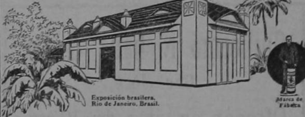
Exposición brasilera, Rio de Janeiro, Brasil.