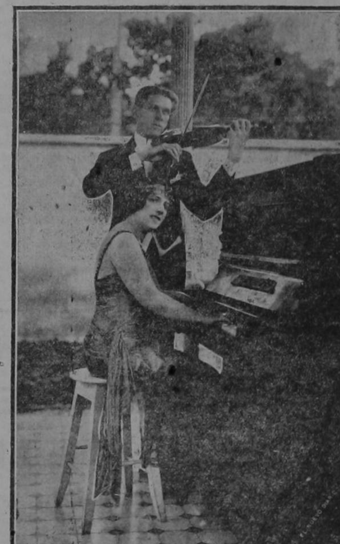
El domingo próximo se ejecutará el concierto en el Teatro Nacional que estaba anunciado para hoy, de los notables artistas Mime Renee Florigny Ivan Tcherkassoff que por circunstancias especiales hubo necesidad de transferir para esa fecha. La merecida fama de que gozan hará, indiscutiblemente, que el éxito más brillante corone los esfuerzos de estos distinguidos concertistas, que hoy son nuestros huéspedes.