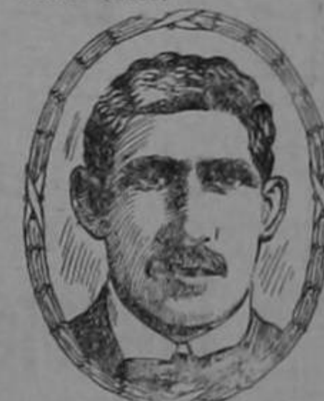
Sr. Gittens. (de la fotografía).

El dolor de espalda es generalmente un indicio de que hay algo de malo en los riñones, y los terribles dolores angustiosos son causados por el paso por riñones débiles ó inactivos de cristales duros de ácido úrico.