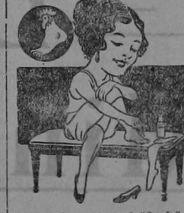
carica de dos o tres gotas de "Gets-It." A los cinco minutos Ud. sólo recuerda su dolor y molestias como un sueño desagradable, y se reprocha a sí mismo por haberlo resistido tanto tiempo. Al siguiente día lo encontrará Ud. bien muerto, y listo para descaerirse de raíz. Cuenta una pequeña E. Lawrence & Co., Fabricantes, Chicago, E.U.A.

Los callos más beligerantes pierden inmediatamente todos sus sentidos al recibir la