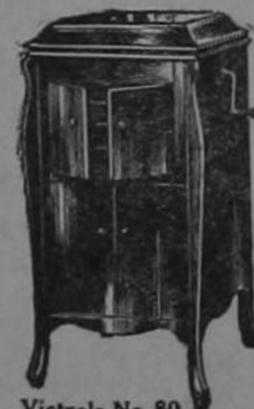
Victrola No. 80 Caoba, Roble o Nogal

Use las Agujas "Tungs-tone" Victrola y no tendrá que cambiar la aguja con cada disco.