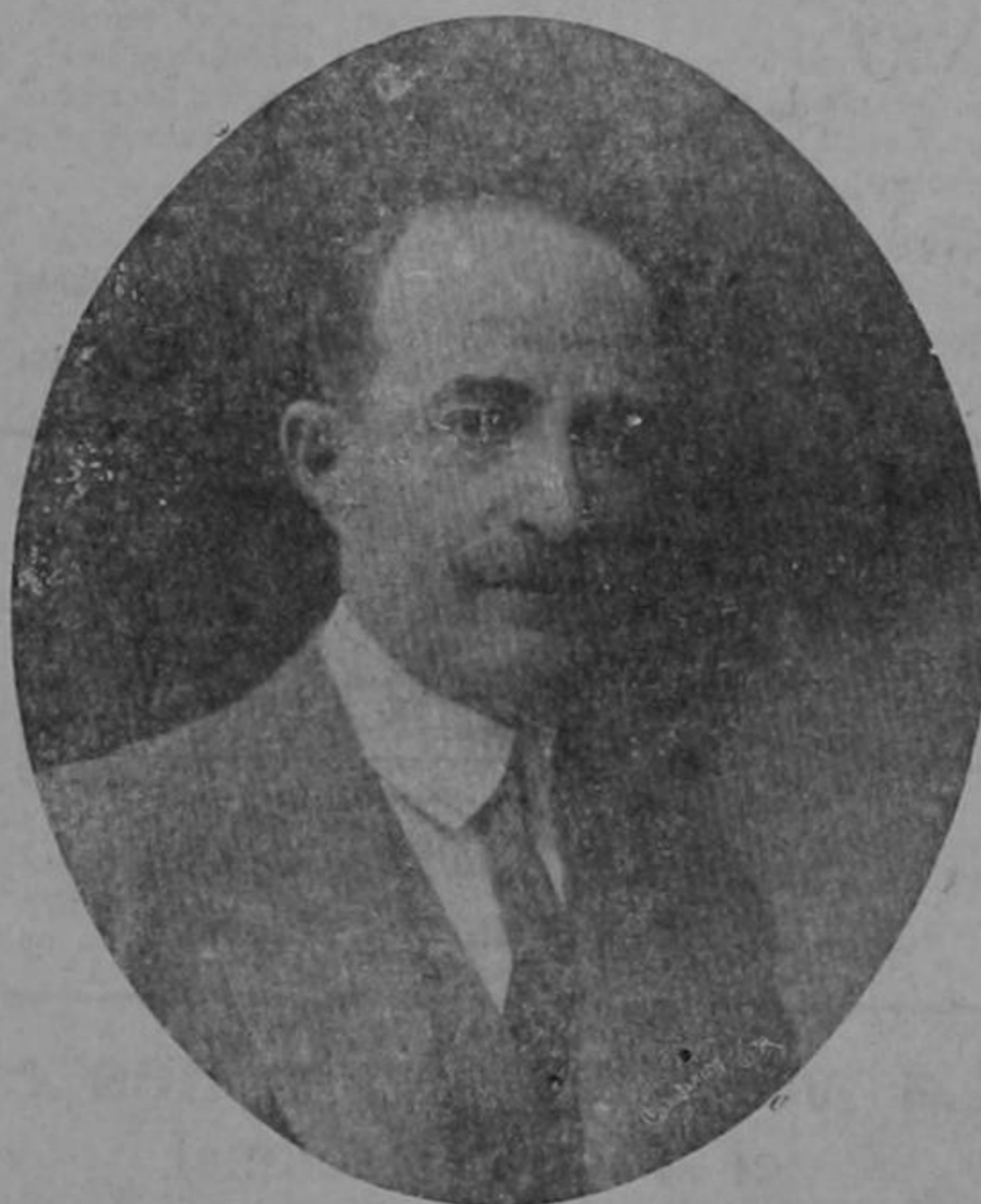
Lic. don Alberto Echandi Montero

Hoy celebra el 55 aniversario de su natalicio el Lic. don Alberto Echandi Montero, uno de los más prestigiosos elementos del foro nacional y a quien una inmensa mayoría de sus conciudadanos proclamaron para candidato a la Presidencia de la República en la última lucha electoral.