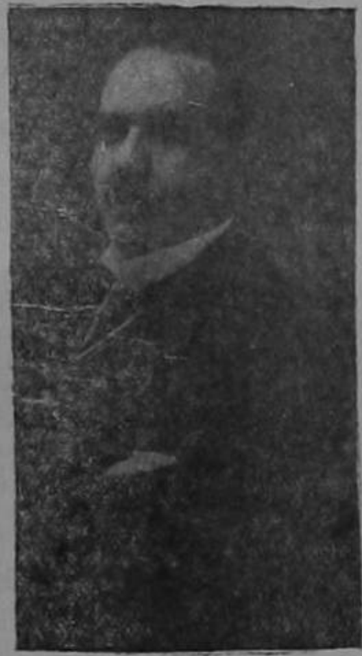
Dr. D. JULIÁN IRÍAS S.

El doctor don Julián Iriás quien desde ayer quedó reconocido en su carácter de Enviado Extraordinario y Ministro Plenipotenciario de Nicaragua en Costa Rica es una de las figuras políticas más salientes de la vecina del Norte.