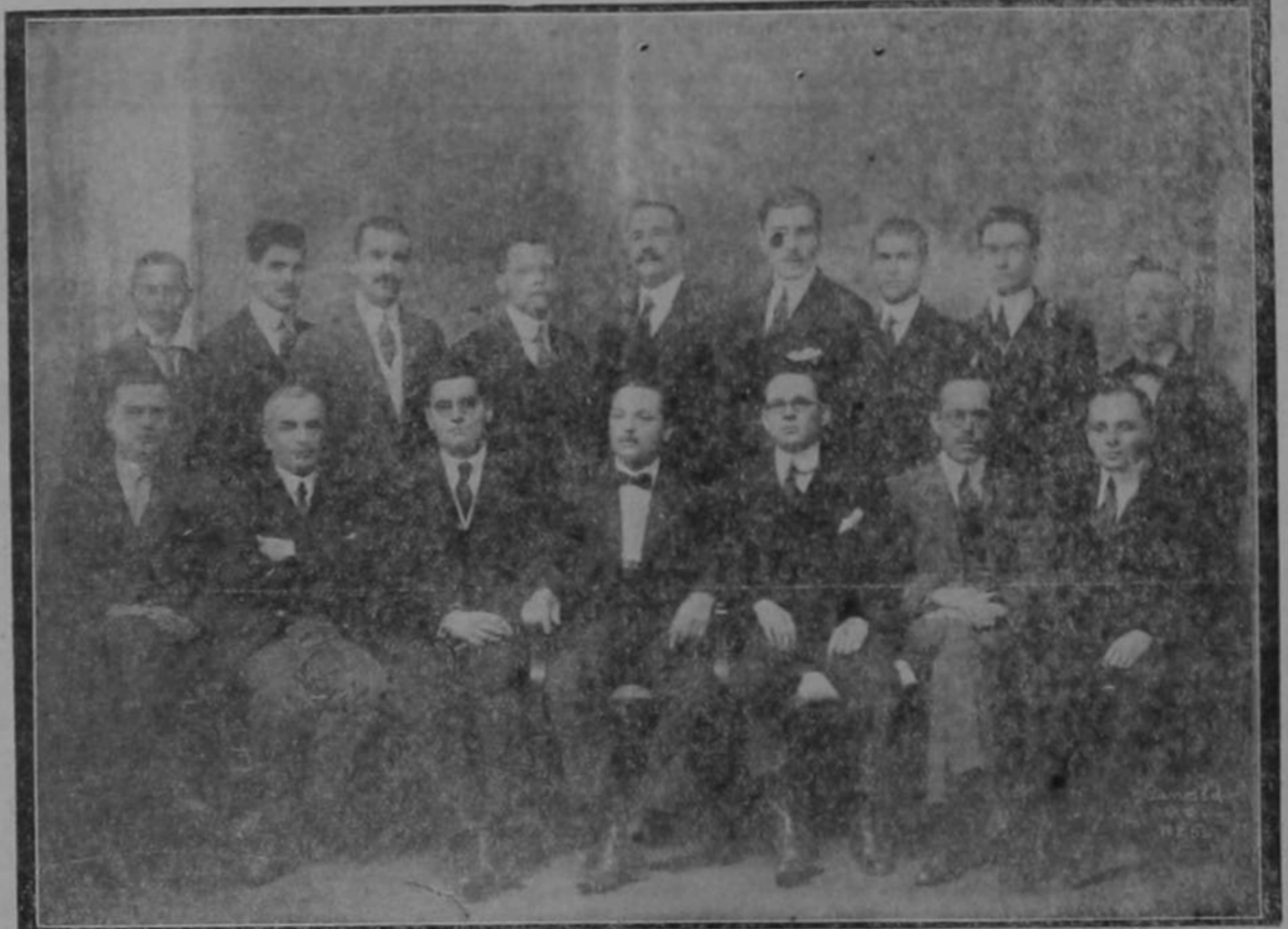
Primeros profesores, fundadores de la Escuela Mercantil Manuel Aragón

En el desenvolvimiento cultural de Costa Rica en estos últimos años, ningún esfuerzo ha sido tan plausible como el establecimiento de la Escuela Mercantil Manuel Aragón en la cual se preparan sanos elementos que desempeñan importantes cargos en diferentes ramos del comercio, y que era realmente una imperiosa necesidad porque en esta escuela se abren nuevos caminos a la juventud, preparando hombres para el porvenir en los campos de una actividad que es fuente de riqueza para el país.