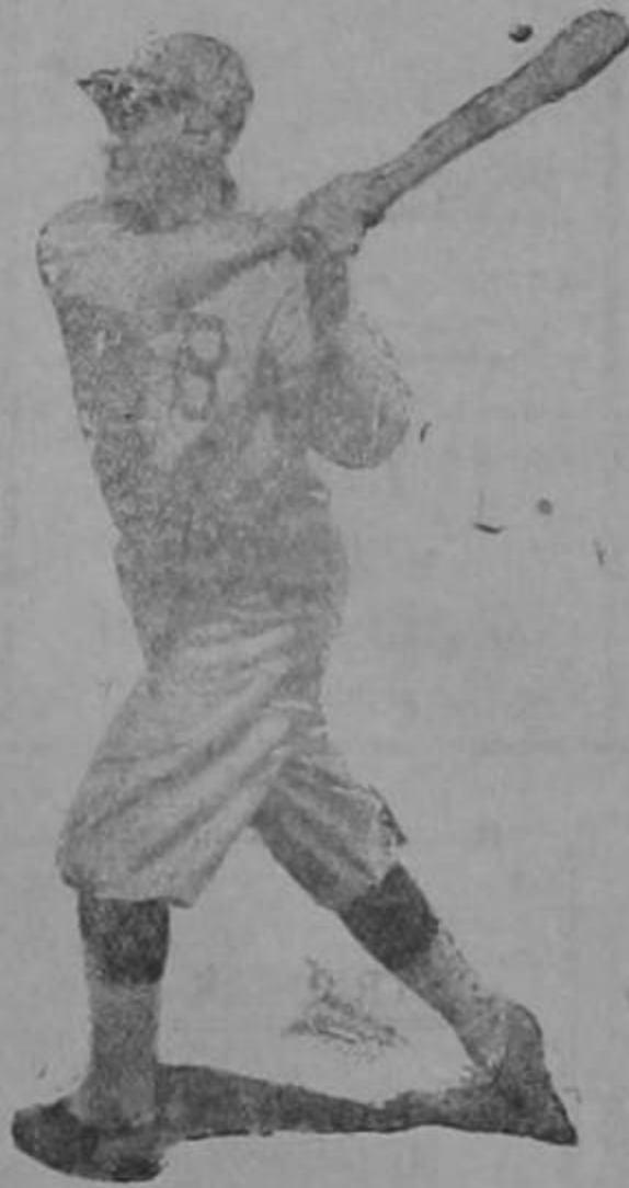
Segunda Fuerza está en las garras del primero.

Queda pendiente de resolver el asunto América—Caribes aunque ya el Campeonato de