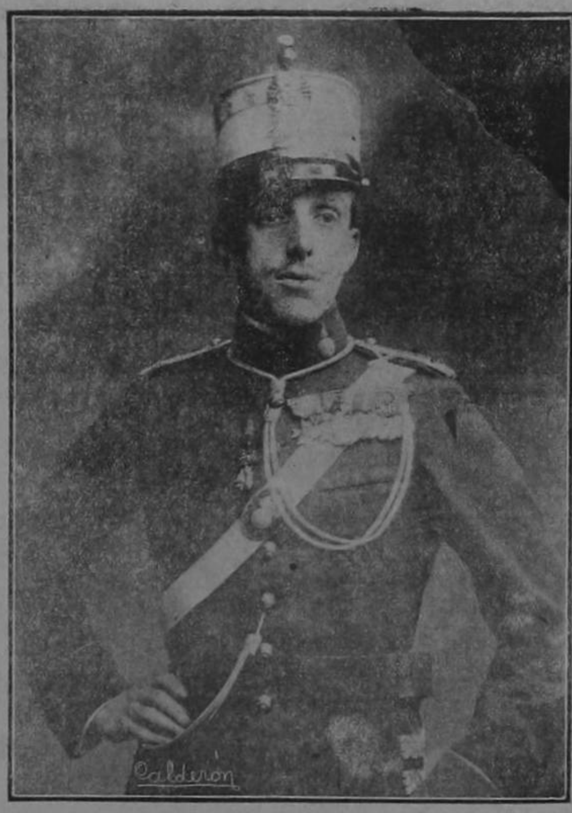
S. M. el Rey de España Don Alfonso XIII

Las monarquías que nos parecieron más sólidas, asentadas en ancha base de dominio militar invencible, se han derrumbado estrepitosamente. Pero en España — agregaba, — Cada vez parece más remota la idea de la caída de la Monarquía, y el mismo cronista reconocía que aquello no era un milagro porque Dios ha puesto frente a los destinos de la vieja y noble nación, cuna del hidalgo D. Quijote, un hombre que es la más sólida garantía de la Patria