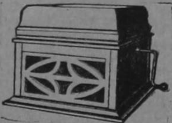
Sonógrafos «Columbia» Columbia Phonograph Co.