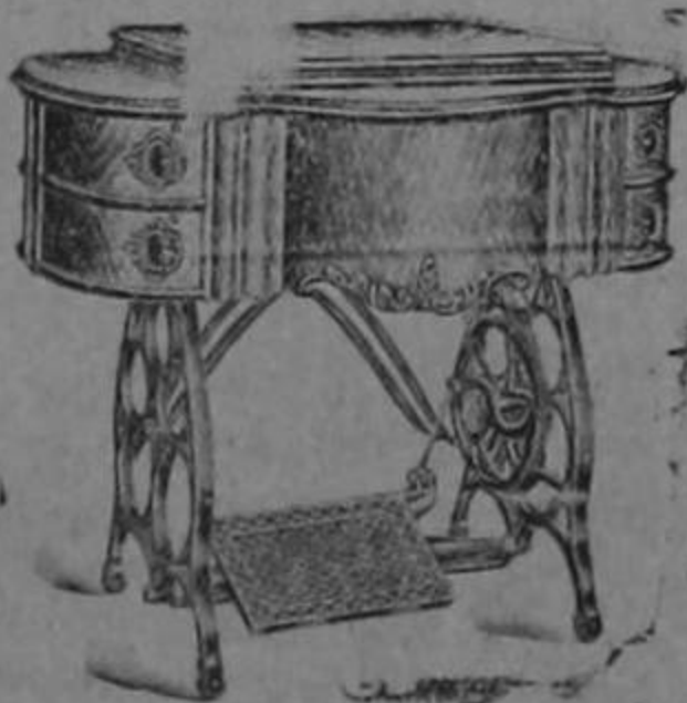
Máquinas de coser «Princesa» National Sewing Machine Co.