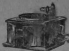
Victrola IV Roble

Estas marcas de fábrica de la Victor aparecen en la tapa de los instrumentos y en la etiqueta de los discos Victor Talking Machine Company, Camden, N.J. U.S.A.