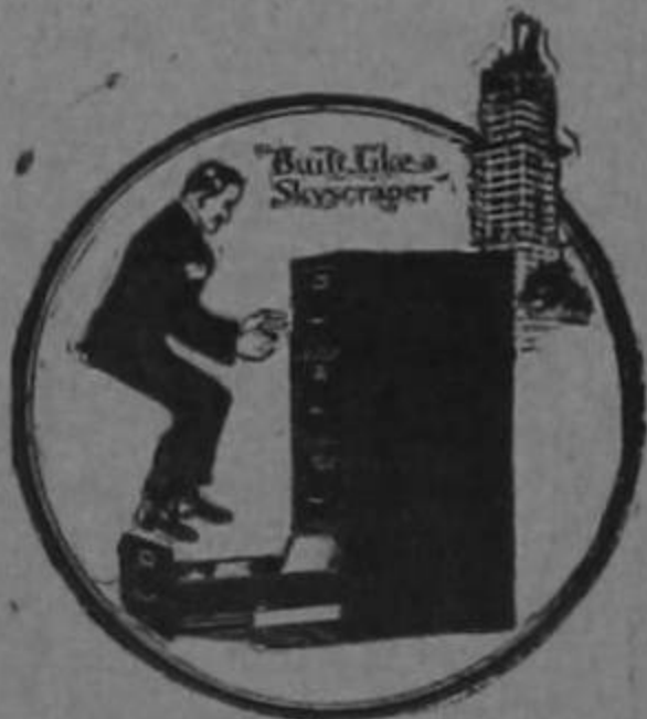
Archivos «Shaw-Walker» The Shaw-Walker Company