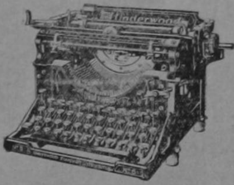
Máquina de escribir «Underwood» Underwood Typewriter Company