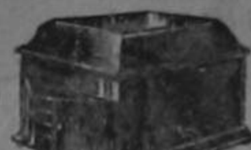
Victrola VIII Roble