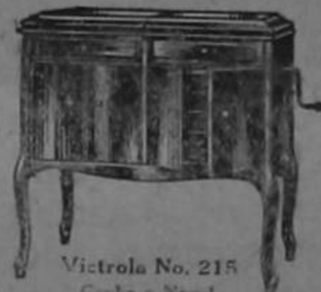
Victrola No. 215 Carbo o Nogal