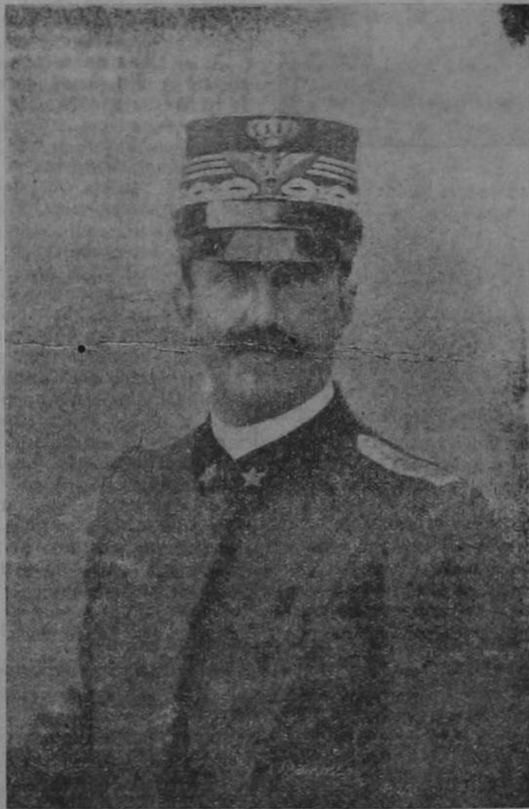
S. M. VICTOR MANUEL III

Casó en Roma el 24 de octubre de 1896, con S. M. la Reina Elena, de la Casa Petrovic