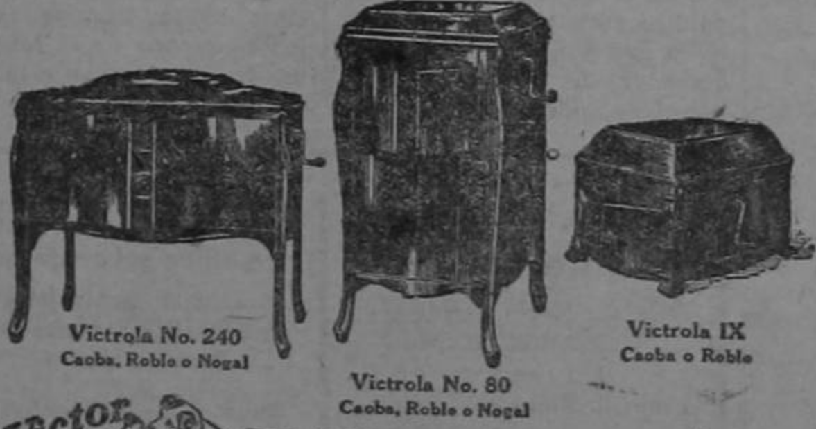
Victrola No. 240 Caoba, Roble o Nogal Victrola No. 80 Caoba, Roble o Nogal Victrola IX Caoba o Roble

Comerciantes Victor al por mayor Piza e Hijos, San Jose, Costa Rica