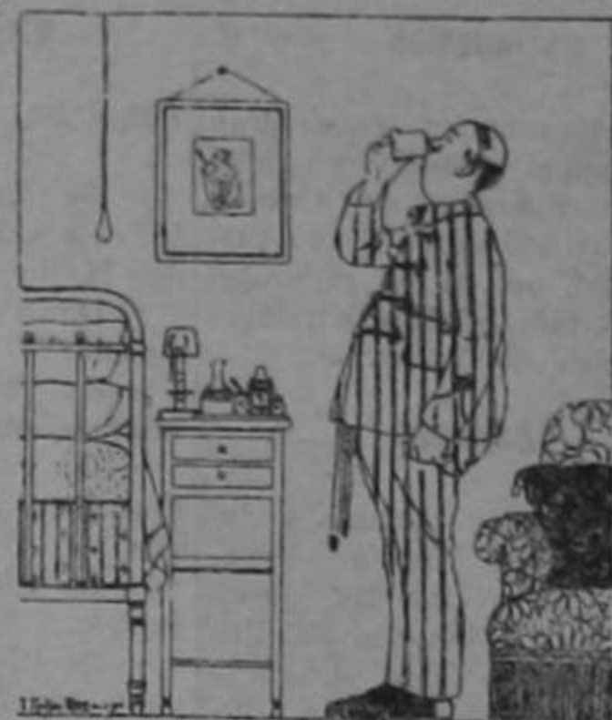
A las 10 de la noche: una copa de URODONAL

No hay que esperar tener cálculos, gota, mal de piedra o reumatismo para tomar el URODONAL