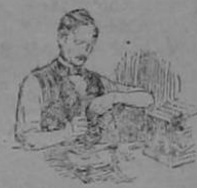
Al convertir su sueño en un hecho, Burroughs se rigió rigurosamente por su ideal de precisión.

Hoy en día todo el comercio, grande y pequeño, deriva grandes beneficios de los estudios y experiencia de la Burroughs, y recurre a ella para la solución de sus problemas de contabilidad. La ayuda de la Burroughs puede obtenerla cualquiera sin el menor costo y sin el menor compromiso.