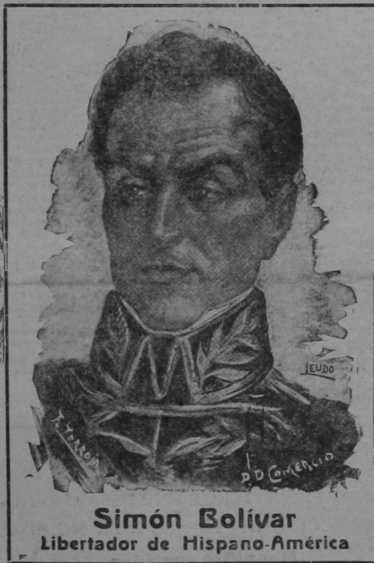
Simón Bolívar Libertador de Hispano-América

La historia ha puesto de relieve en el monumento de la libertad continental la figura sagrada del héroe que luchó en los ventiqueros de los Andes, en los pantanos del Ori-