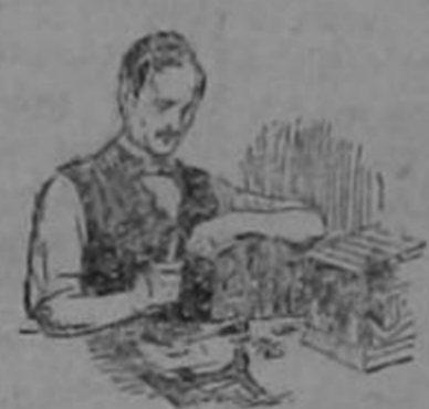
Al convertir su sueño en un hecho, Burroughs se rigió rigurosamente por su ideal de precisión.

Escriba o llame por teléfono para cualquier ayuda o información y recibirá usted inmediata atención en lo que se le ofrezca. Cualquier servicio que le preste la Burroughs es solamente una continuación del que formaba el ideal de William Seward Burroughs.