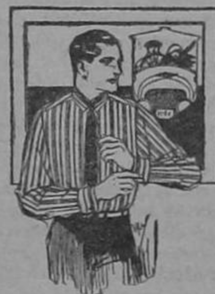
GEO. F. IDE & CO., INC. TROY, N. Y., E. U. A.

Famosas por su ajuste perfecto, larga duración y colores garantizados.