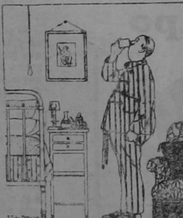
A las 10 de la noche: una copa de URODONAL

No hay que esperar tener cálculos, gota, mal de piedra o reumatismo para tomar el URODONAL