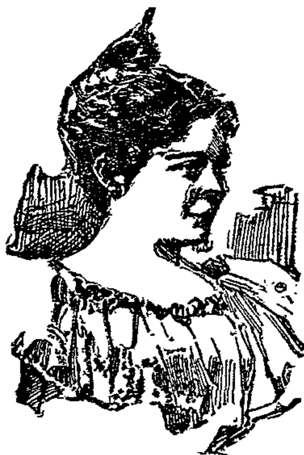
ADELINA PATTI, LA GRAN SOPRANO DEL MUNDO.

Madame Patti, la célebre cantatriz aun conserva un cutis hermosa no obstante su edad tan avanzada, lo cual depende del uso de cierta clase de jabones que á la vez que son un tónico, hermosean la piel. Esta, como el cuerpo, cuando se encuentra enfermo, necesita un restaurador. En realidad existe solamente un remedio que en forma de jabón puede obrar provechosamente tanto en casos de erupciones cutáneas como para devolver á la piel su suavidad y blancura.