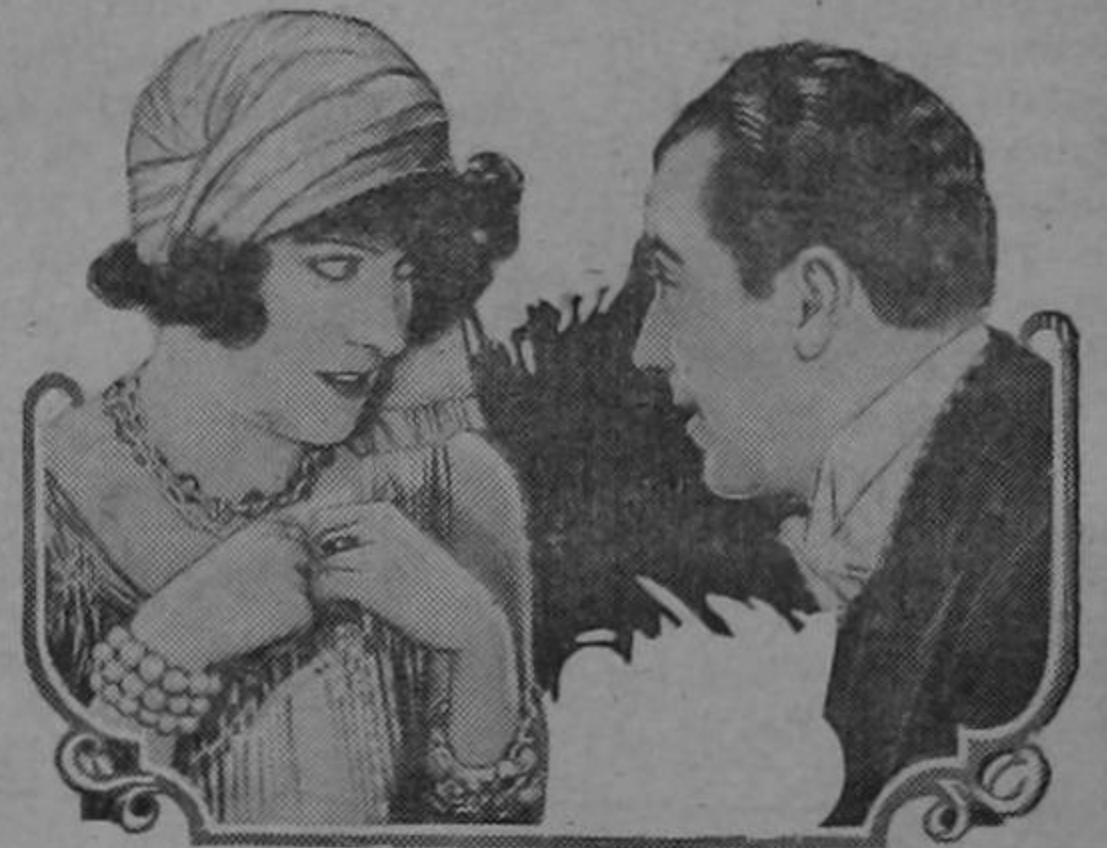
GLORIA SWANSON AND EUGENE O'BRIEN IN A SCENE FROM "FINE MANNERS" A PARAMOUNT PICTURE

Una preciosa y admirable película Paramount nos ofrece la empresa del Teatro Faventós para su jueves de moda. Se titula «Lindos modales» y es una admirable comedia cinematográfica llena de encantos en donde la admirable artista Gloria Swanson una de las estrellas más predilectas de nuestro público, hace una admirable creación artística.