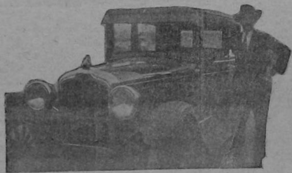
Don Yauvario Bastos, de Alajuela, con su carro PONTIAC-SEIS

Lo que nos dice un propietario de este magnífico automóvil