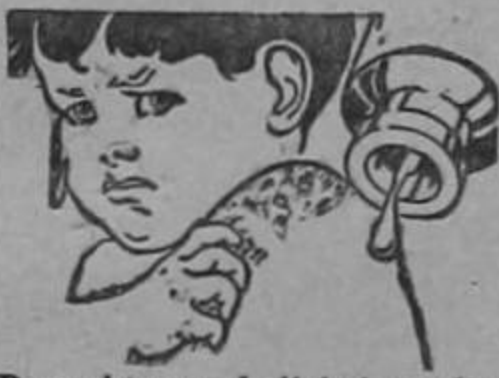
Para obtener el alivio inmediato del ardor y escozor del eczema, úsese LAVOL. Pruebe unas cuantas gotas sobre la piel.

Tal tratamiento se ha mostrado igualmente eficaz para los caballos; pero éstos hay necesidad de administrarles por la fuerza la cantidad de cloruro de sodio necesaria para matar las garrapatas, para lo cual se emplea la sonda esofágica, introducida por las narices.