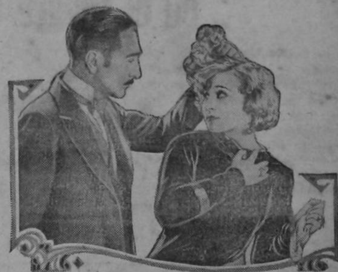
Adolphe Menjou and Greta Nissen in 'Blonde or Brunette' A Paramount Picture

Un selecto jueves de moda nos ofrece el teatro Raventós hoy. Un programa lleno de atracción que hará pasar a la concurrencia en sus 3 funciones ratos muy agradables.