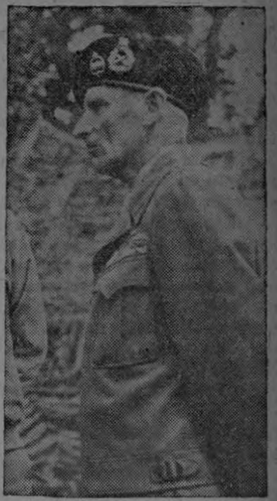
Gral. Montgomery El vencedor de Al Alamein

LONDRES, Agosto, 1. — De acontecimientos recientes han simbolizado el cierre de una fase de esta guerra y la apertura de otra. El Octavo Ejército Británico con su casi legendaria tradición creada en cuatro cortos años, ha sido disuelto oficialmente, y un nuevo ejército británico, el duodécimo, ha librado su primera acción en Birmania con el mayor éxito. Una fuerza desesperada y fanática nipona atrapada en la región de Pegu Yomas, entre Mandalai y Rangún, ha sido derrotada en una de las batallas mas sangrientas de la campaña.