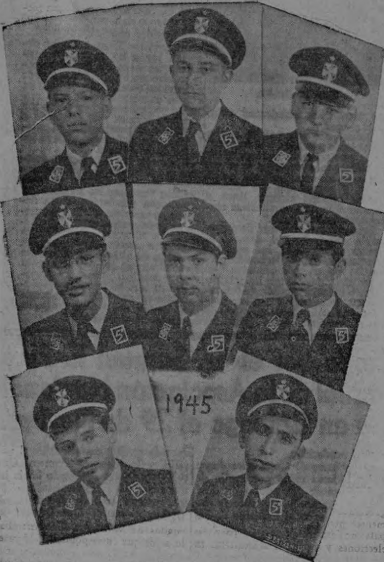
(Lectura en página 10)