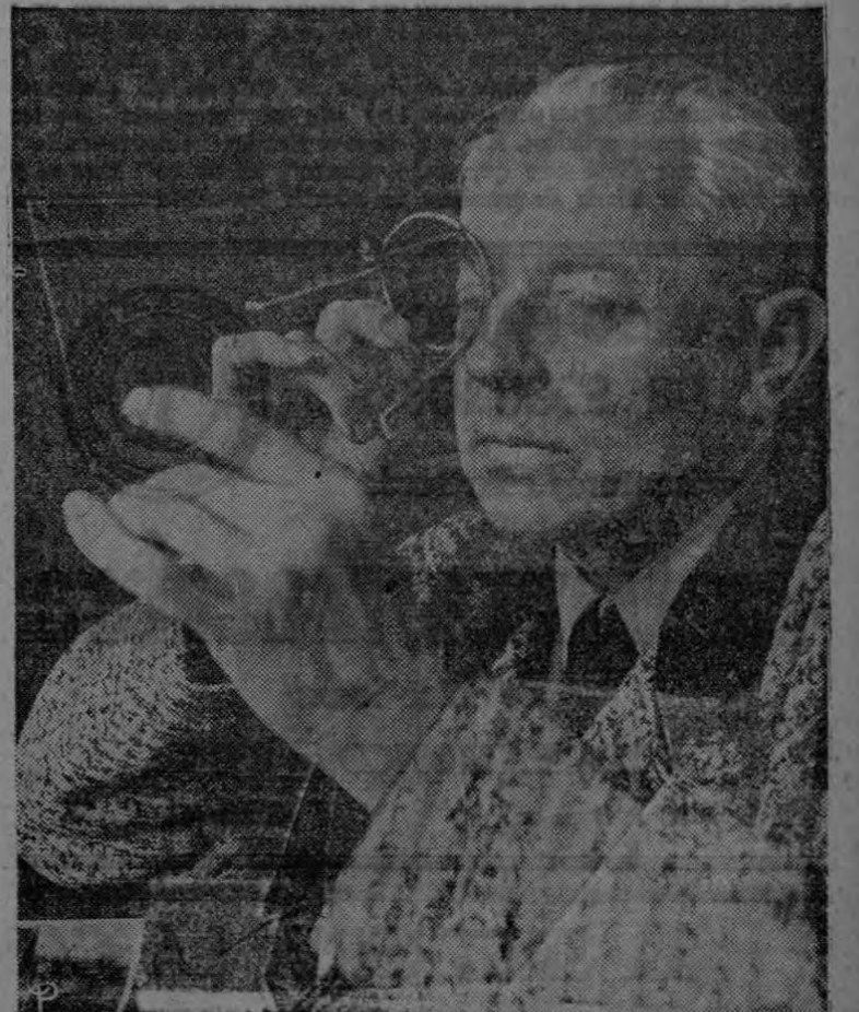
EL FOTOGRAFO DE HITLER.—Heinrich Hoffmann, en otro tiempo fotógrafo personal de Adolfo Hitler, ayuda actualmente al Departamento de Evidencias Fotográficas, norteamericano, en la recopilación de pruebas que pueden ser usadas en el proceso que se le sigue en Nuereberg a los altos nazis acusados de crímenes de guerra.