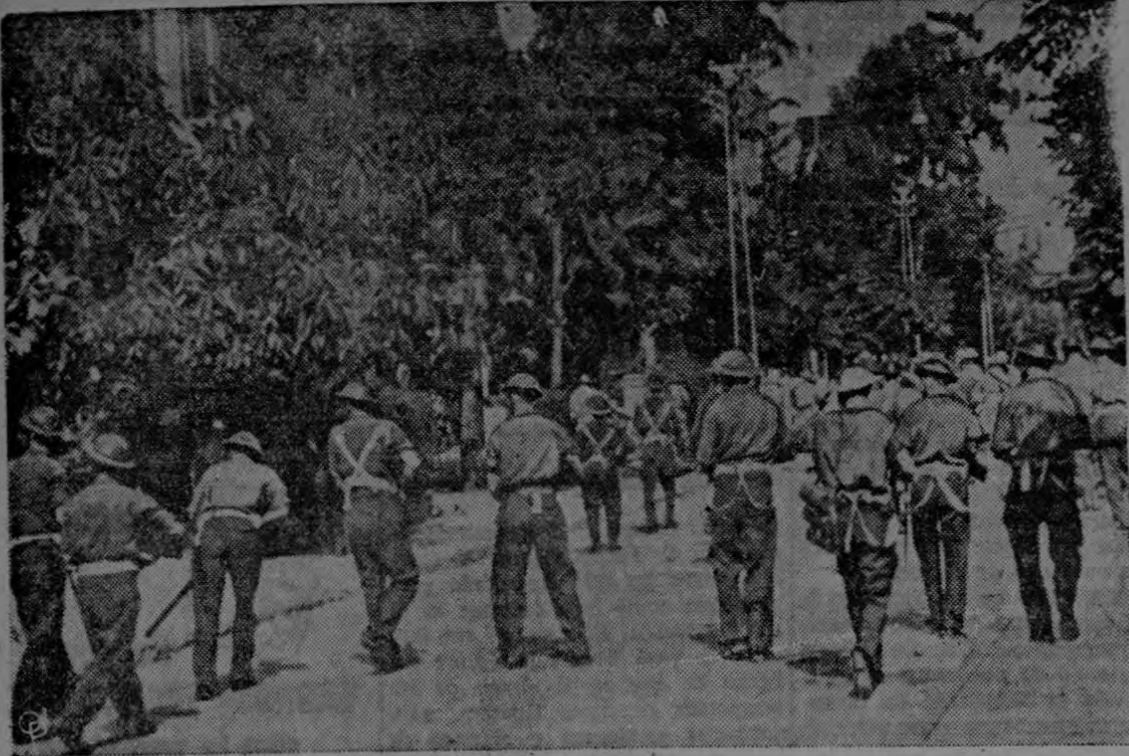
Miembros de la Sexta División de Paracaidistas Británicos, marchan por las calles de Tel Aviv, Palestina, manteniéndose en guardia contra los amotinados.