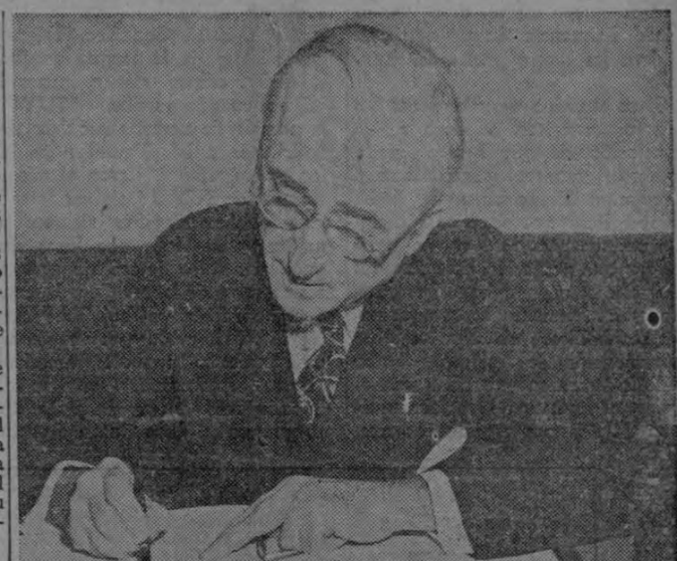
El Secretario de Estado, James F. Byrnes, firma el documento de ratificación que hizo del Organismo de Seguridad Mundial de las Naciones Unidas un hecho consumado.

WASHINGTON.—La aspiración de paz mundial, por la cual dos presidentes de los Estados Unidos: Woodrow Wilson y Franklin D. Roosevelt, laboraron hasta sus últimos días, alcanzó el status de organismo real cuando el Secretario de Estado, James F. Byrnes, firmó en esta ciudad el documento de ratificación que hizo el Organismo de Seguridad Mundial de las Naciones Unidas un hecho consumado.