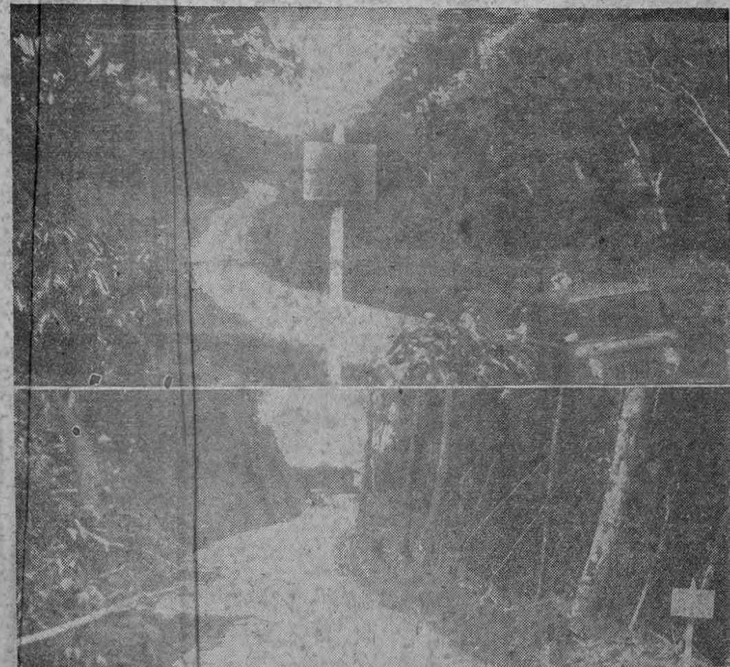
Estos son dos aspectos de la magnífica red de caminos de penetración agrícola que, debidamente lastrados, están construyendo laborantes al servicio de la SICA. La construcción de estas vías de comunicación en el sur del país se ha hecho mediante financiación hecha por el Fondo de Desarrollo Económico del gobierno de los Estados Unidos