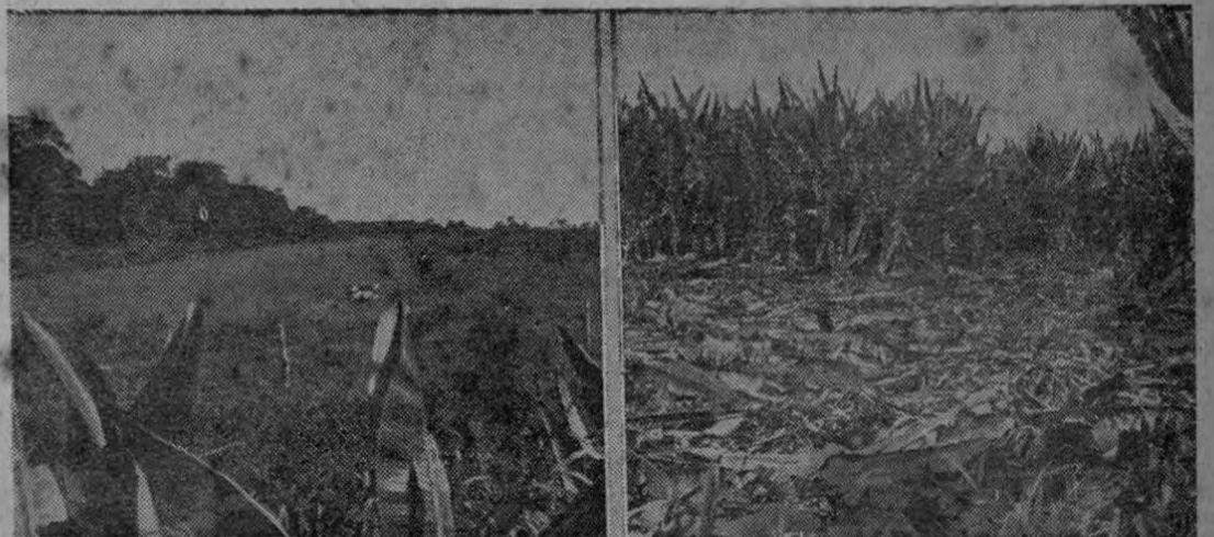
El campo de aterrizaje de 24 Millas —izquierda—, puede ser ampliado para habilitar Bataán también desde el aire. Actualmente aviones de Limón hacen contacto con esa pista.

Una comisión integrada por personeros del Banco Anglo Costarricense y el Banco de Costa Rica se entrevistó esta mañana con delegados de la Compañía Bananera de Costa Rica a efecto de tratar los trascendentales problemas del Atlántico y en especial de Bataán. Sin noticias confirmadas — Pasa a la Pág. CUATRO