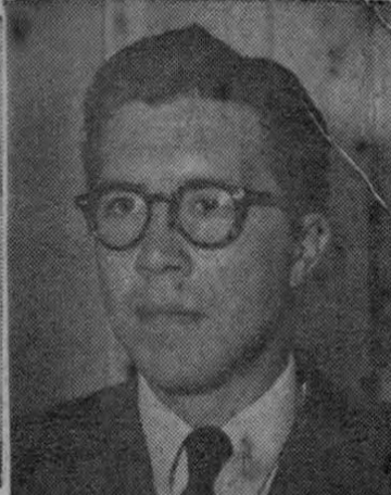
Ministro Vargas Gené

El cable trae intranquilidad en círculos comerciales y de transporte.— Agencias aduanales del país nerviosas.— Ferrocarriles del Pacífico y del Atlántico sufrirán consecuencias.— Paralización afecta de Maine a Texas, EE. UU. —