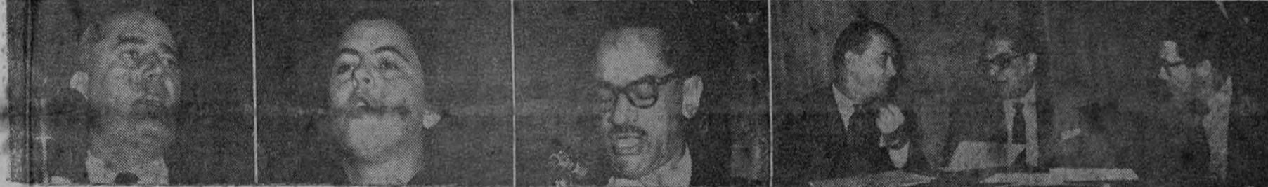
Explicamos así las gráficas que reproducimos: arriba, panorámica del interior del Teatro Nacional, en los momentos de iniciarse el Congreso de la ANDE. Abajo: de izquierda a derecha: el señor Presidente de la República, Lic. Mario Echandi,