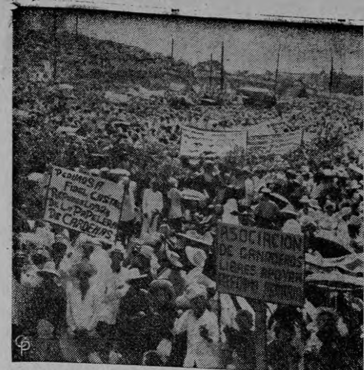
CELEBRACION EN CUBA. —La foto recoge un aspecto de una parte de la multitud de más de 500.000 cubanos que inundaron la Plaza Cívica de La Habana para celebrar el sexto aniversario del Movimiento Revolucionario 26 de Julio. La jublosa multitud escuchó de labios de su líder Fidel Castro, que éste regresaría de nuevo a la posición de Premier

La OTAN exige más que una devoción ritual periódica.