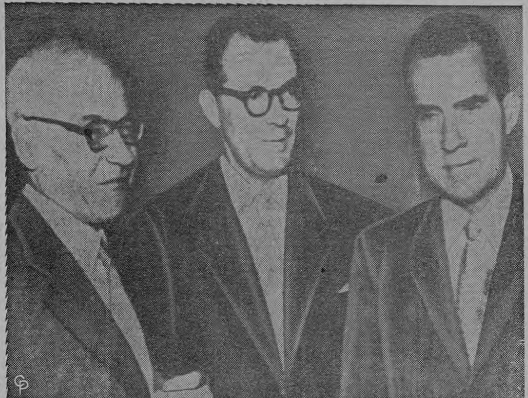
NIXON Y EL JEFE ROJO DE POLONIA.—Después de haber recibido una entusiasta bienvenida de las multitudes en Varsovia, el Vicepresidente Richard M. Nixon (derecha) comienza un discurso acerca de serios problemas mientras es acompañado por Wladyslaw Gomulka (izquierda), Primer Secretario del partido comunista de Polonia. Al centro, un intérprete no identificado. Según se informó, las conversaciones con los oficiales giraron sobre el ruego de los polacos sobre el crédito norteamericano.