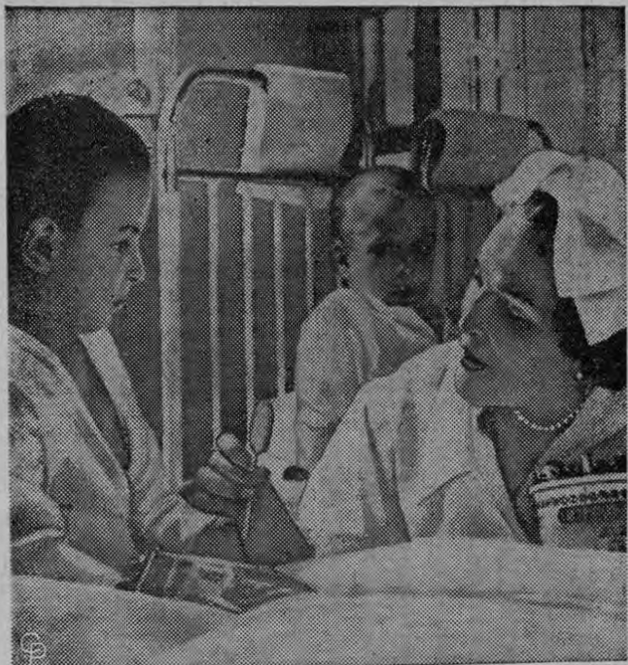
VISITA A UN HOSPITAL DE MOSCU. — La esposa de Richard M. Nixon, el Vicepresidente de los Estados Unidos, visita el Hospital Infantil de Moscú, mientras su esposo se entrevistaba con el Primer Ministro soviético Nikita S. Krushchev. En la foto aparece la Sra. Nixon obsequiando a un pequeño algunos caramelos

Luego dice el diario que en el curso de las pocas semanas que deberán transcurrir antes del cambio de visitas, es deber de todos los políticos crear una atmósfera favorable a las trascendentales entrevistas de los dos mandatarios.