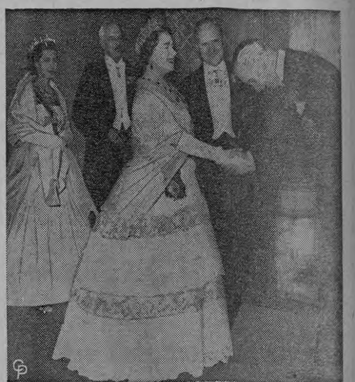
RECIBEN A LA REINA El General Sir Hugh Stockwell le da la bienvenida a la Reina Madre de Inglaterra, a su arribo al Guild Hall de Londres, durante la celebración del 200 aniversario de la Batalla de Minden, en la cual los británicos derrotaron a la caballería francesa. A la izquierda se encuentra la Princesa Margarita. Los demás no fueron identificados.

LA HABANA 10 (UPI) — "Revolución", órgano oficial del Movimiento 26 de Julio del Primer Ministro, Fidel Castro, admite por primera vez en una información con título a ocho columnas, la existencia de una conspiración en la que estaban complicadas más de mil personas detenidas durante el pasado fin de semana. Esa información fue dada el sábado por la United Press International. "Revolución" cataloga a los detenidos como numerosos elementos contrarrevolucionarios vinculados a Trujillo y los criminales de guerra que estaban vertebrando desde hace meses una vasta y criminal conjura contra el país". Agrega que los principales participantes en la conspiración eran "elementos del antiguo ejército y también estaban complicados varios latifundistas afectados por las leyes revolucionarias". Los detenidos han sido alojados en el campamento Libertad, así como en Managua, San Antonio y otros lugares. "Revolución" declara que no reveló antes la conspiración porque no quería perjudicar al esfuerzo de las autoridades revolucionarias. NO HUBO DESEMBARCOS.— Asimismo desmiente que hayan ocurrido desembarcos como se anunció en otras partes. "El Crisol", el único otro diario que se publica regularmente los lunes por la mañana, publica una información casi idéntica a la de "Revolución".