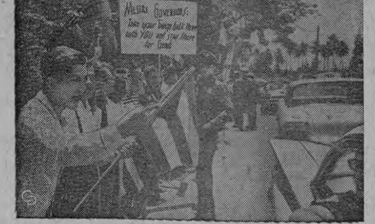
EN LA CONFERENCIA DE GOBERNADORES.—Abandonando una reunión del comité de defensa civil de la 51 Conferencia Anual de Gobernadores en San Juan, Puerto Rico, aparecen, de izquierda a derecha: Nelson A. Rockefeller, Republicano, de Nueva York; G. Mennen Williams, Demócrata, de Michigan, y Edmund G. (Pat) Brown, Demócrata, de California. Williams y Brown dijeron que Rockefeller sería para un Demócrata más difícil de derrotar para la nominación presidencial que el vicepresidente Richard M. Nixon. Abajo, un grupo de independentistas con banderas y cartelones, le gritan a los gobernadores que son conducidos en automóviles.

LA HABANA 10 (UPI) — En horas de la mañana de ayer hubo un intento contra la vida de Raúl Castro, hermano del Primer Ministro Fidel Castro. Mientras se celebraba una boda en una de las principales iglesias de La Habana, y en la que Raúl Castro figuraba como invitado. Cuando los novios tomaban posición delante de Castro, en un individuo no identificado, y tan pronto como estuvo bien ubicado sacó una pistola del bolsillo del pantalón y la apuntó hacia el joven hermano del Primer Ministro, pero varios barbudos que asis-