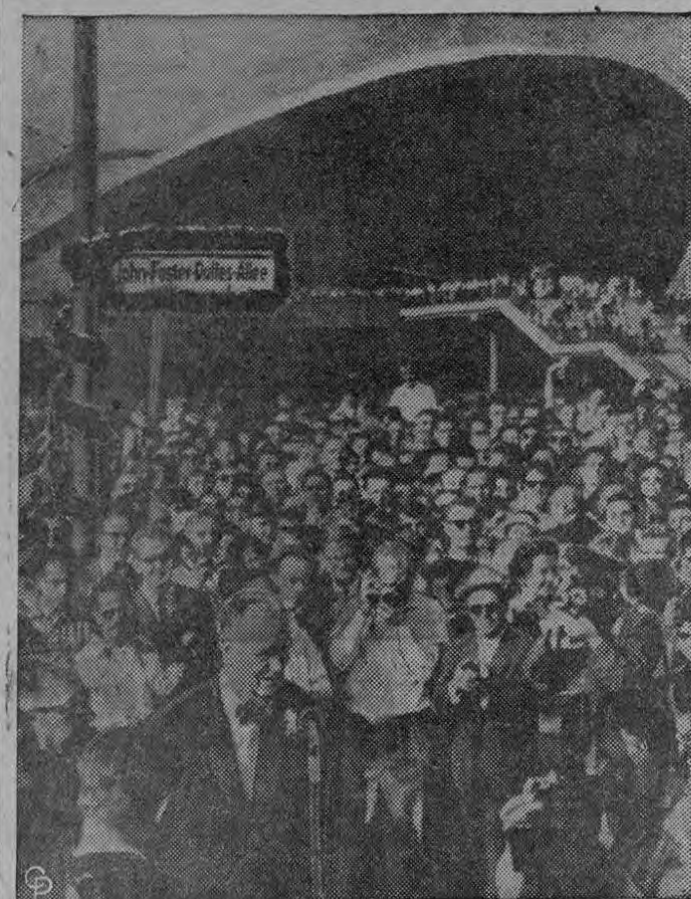
HOMENAJE A LA MEMORIA DE DULLES. — El Secretario de Estado, Christian Herter (al centro) recibe la ovación de los alemanes del Berlín Occidental durante la ceremonia llevada a efecto en el Parque Tiergarten, cuando Zoltan Zee Allee fue renombrado John Foster Dulles Allee, en memoria del desaparecido Secretario de Estado norteamericano. Herter le aseguró a la multitud compuesta por miles de jubilosos alemanes que el Occidente nunca sería sacado de la dividida ciudad

partió para el lugar del accidente se ha formado un convoy dente a fin de investigar. Tam terrestre.