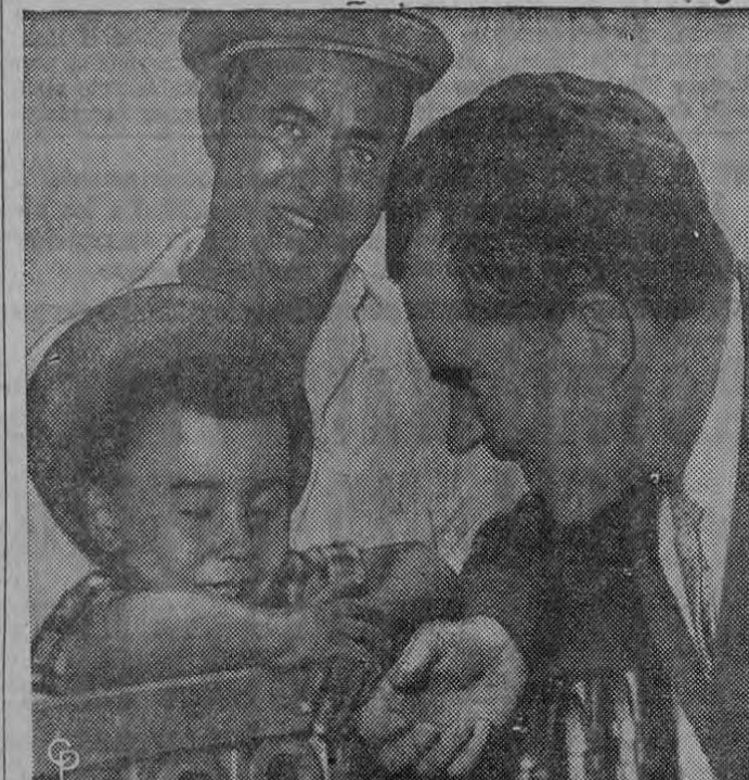
NIXON EN GINEBRA.—El Vicepresidente Richard M. Nixon conversa con un niño, en Sverdlovsk, Siberia, mientras varios rusos sonrientes contemplan la escena. Visitando una fábrica de acero de la zona, el Vicepresidente fue rociado por el agua que salía de una maquinaria. Más tarde, Nixon dijo, en un breve discurso, que la forma para reducir las sospechas entre los soviéticos y los Estados Unidos era "a través del contacto personal".

"Nuestras siembras se presentan hasta el momento con magníficas perspectivas, halagadoras al máximo, haciéndonos tener fe en que obtendremos ricas cosechas especialmente en cuanto a maíz y arroz, esto si no se nos viene una plaga o algún fenómeno natural, como en años anteriores. Considero que si esto de la agricultura se está tornando en un problema, ello se debe al abandono en que se nos tiene a los agricultores y de continuar tal abandono, en años futuros el problema será aún más grave. El Ministerio de Agricultura y el Consejo de Producción deben ayudarnos más, para poder ensanchar nuestras siembras. Vergüenza es que Costa Rica tenga que importar granos, ya que podemos producir para exportar, pero, como digo, nadie apoya, a nadie importa la suerte del agricultor y de allí que enfrentemos esa vergüenza de traer del exterior arroz y frijoles".