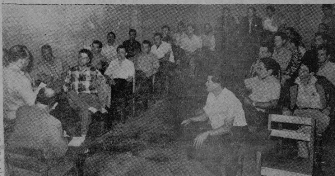
Los empresarios de transporte aparecen en la gráfica cuando asistieron a una reunión en la Dirección del Tránsito para tratar de aspectos relacionados con la coordinación de transportes

Se efectuó una reunión en una de las dependencias de la Dirección General de Tránsito. El Mayor Quesada citó para esta, a todos los empresarios que tienen líneas urbanas y con cantones cercanos a San José. La concurrencia fue de más de 40 empresarios. Todos animados del mejor propósito de cooperar en beneficio del usuario y de sus propias empresas. El Mayor Quesada les hizo ver tres aspectos muy importantes, a saber: