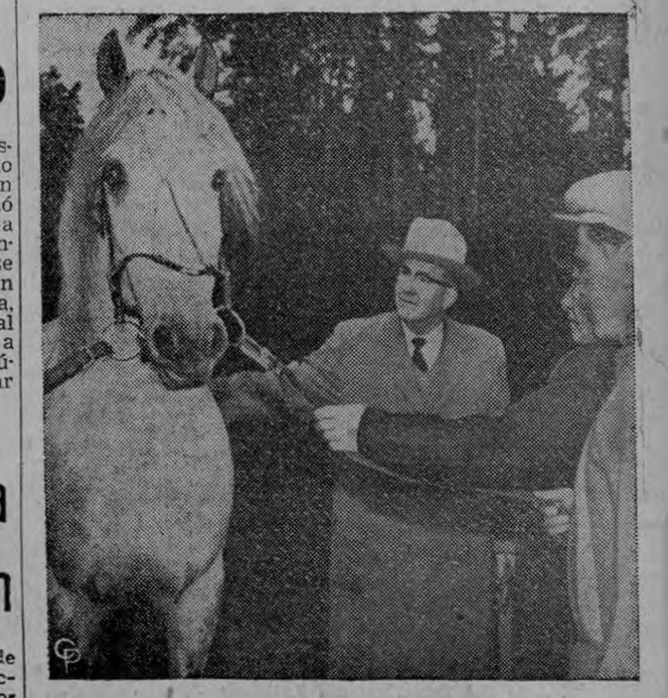
BENSON VISITA UNA GRANJA COMUNISTA. — Durante su viaje a Rusia, el Secretario de Agricultura de los Estados Unidos, Earl Taft Benson (centro) visitó varias granjas soviéticas. En la foto, Benson admira a un caballo ganador de premios, durante un recorrido por la caballería de una finca en las afueras de Mosú. Antes de marcharse para Helsinki, Finlandia, Benson pronunció un sermón de "amor y verdad" en una vieja iglesia de Mosú

Se nos informó esta mañana en la Inspección General de Ha- cienda de San José que son nu- merosas las denuncias que están siendo formuladas diariamente contra comerciantes capitalinos que infringen las leyes de De- fensa Económica. Varias patrullas del Resguar- do Fiscal vienen recorriendo di- ferentes establecimientos comer- ciales logrando el decomiso de latería en mal estado, produc- tos que son vendidos a precios de especulación, licor clandesti- no, cigarrillos extranjeros sin marbete y otras infracciones por el estilo. Todos los comercian- tes que hasta el momento han sido sorprendidos especulando, han sido puestos a la orden de la autoridad competente.