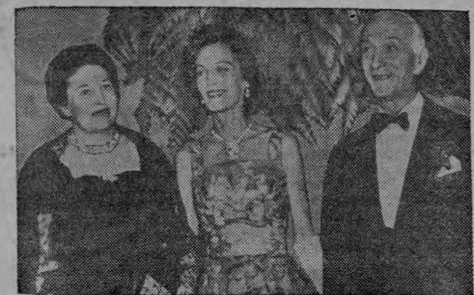
CENA EN HONOR DEL PREMIER ITALIANO.—La esposa de Richard M. Nixon, vice-Presidente de Estados Unidos, aparece en Washington en compañía del Premier de Italia Antonio Segni y la esposa de éste en la cena ofrecida en honor de los Segni por el vice-Presidente y su esposa. Los Segni, quienes se encuentran en los Estados Unidos en una visita de cinco días, comieron con el Presidente Eisenhower y la Primera Dama, poco antes de que el Jefe Ejecutivo norteamericano se marchara a California, donde tomará un descanso de 8 días.

Dio a entender el Primer mandatario que el gobierno no ha aceptado la cooperación de partidos que obedecen a directivas foráneas.