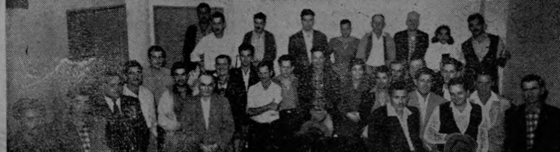
Artavia captó anoche, cuando estaban reunidos los inquilinos del Mercado Borbón, estas dos instantáneas: 1ª la Junta Directiva del Sindicato de esos inquilinos, en los momentos de celebrarse la Asamblea General. Luego, los asistentes se ponen de pie para votar una proposición. Esta Asamblea se verificó en el Ministerio de Trabajo

de celebrarse la Asamblea General. Luego, los asistentes se ponen de pie para votar una proposición. Esta Asamblea se verificó en el Ministerio de Trabajo