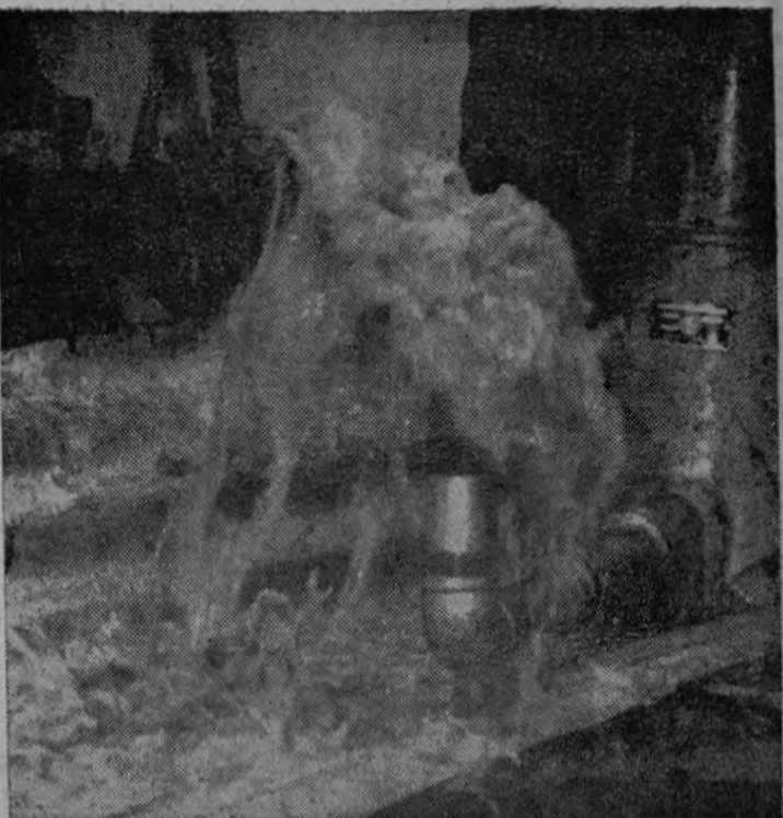
Este pozo artesiano en el corazón de la capital: el del Banco de Costa Rica, comenzó a producir agua hoy a las 9:37 horas

LAS CAPAS DEL SUBSUELO JOSEFINO Es interesante consignar los datos que nos dió esta mañana — Pasa a la Pág. OCHO