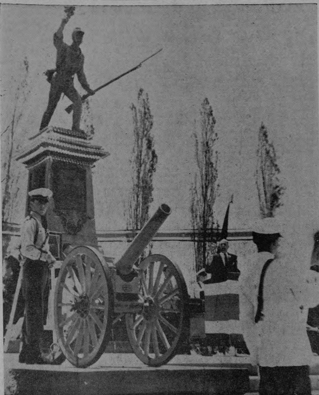
Contra el fortín de fondo de la estatua del héroe Juan Santamaría el Presidente de la República pronuncia su discurso de esta mañana en Alajuela. Viejos cañones del 56 contrastan con el uniforme moderno de un Guardia Civil en posición de firme. Al lado los estudiantes