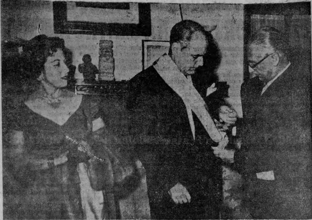
Lucida recepción se efectuó anoche en la Embajada de España, ofrecida por el señor Embajador de España y la señora de Núñez del Río, con motivo de la imposición de las insignias de la Gran Cruz de Isabel la Católica, al Excmo Sr. Presidente de la República y en honor también de doña Olga de Echandi. En la fotografía se ve al señor Embajador de España en el momento de colocarle dichas insignias al Jefe del Estado, mientras su distinguida esposa doña Olga de Echandi observa la escena.