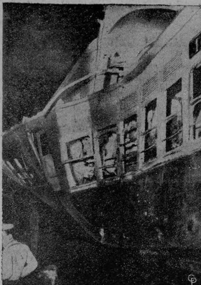
MUEREN 60 EN CHOQUE: En la foto aparece uno de los coches después que dos trenes de pasajeros chocaron cerca de una estación suburbana a ocho millas de la parte comercial de Sao Paulo, Brasil. Por lo menos 60 personas murieron y cientos se lesionaron.

Explicó que los agentes realizaron el procedimiento tras recibir una "información".