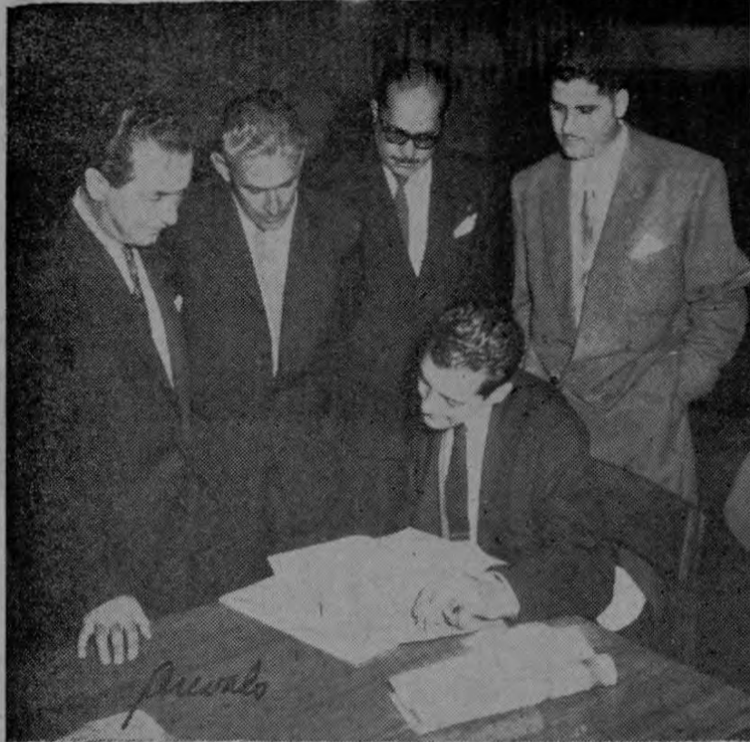
Anoche tras una importante reunión, entre el señor Ministro de Hacienda, diputados de las diferentes fracciones parlamentarias y miembros del Comité Organizador, se llegó a un satisfactorio acuerdo para la financiación del Tercer Panamericano de Fútbol que definitivamente se celebrará en nuestra capital en el próximo mes de marzo.