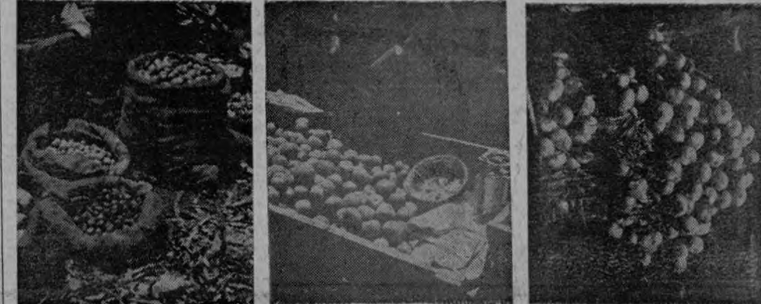
Naranjas Tomates Cebollas

de sol a sol hace germinar cosechas de las sementeras, llamamos hoy al lector una impresión, exacta hasta donde nos fue posible, de esa gama de términos y frases tan usuales como "oferta y demanda", "asistencia técnica", "protección y ayuda al pequeño productor", "créditos" y "agiotismo".