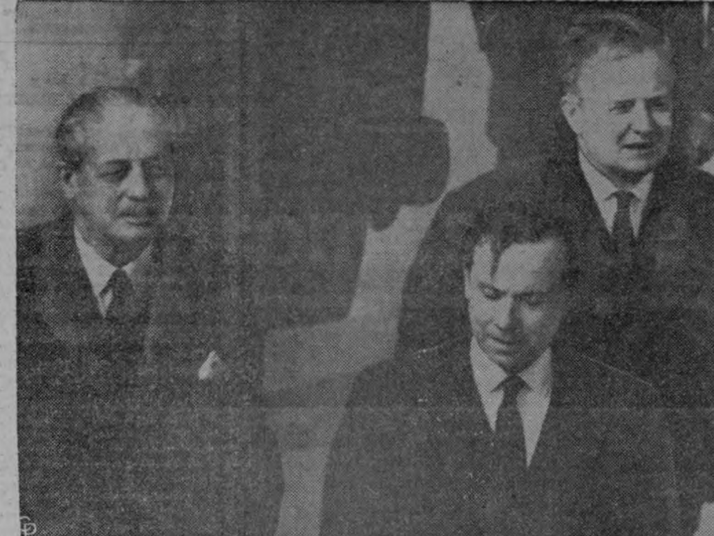
El Primer Ministro británico Harold MacMillan (izquierda), y el Canciller de su gobierno Selwyn Lloyd, son recibidos por el Premier de Francia Michel Debre (centro), MacMillan, en la primera etapa de un recorrido por las principales capitales aliadas para consultar sobre la política occidental con respecto a Rusia, colocó al Presidente francés Charles De Gaulle en primer lugar de la lista. Luego visitará al Canciller Konrad Adenauer, de Alemania Occidental, y finalmente volará a Canadá y los Estados Unidos.