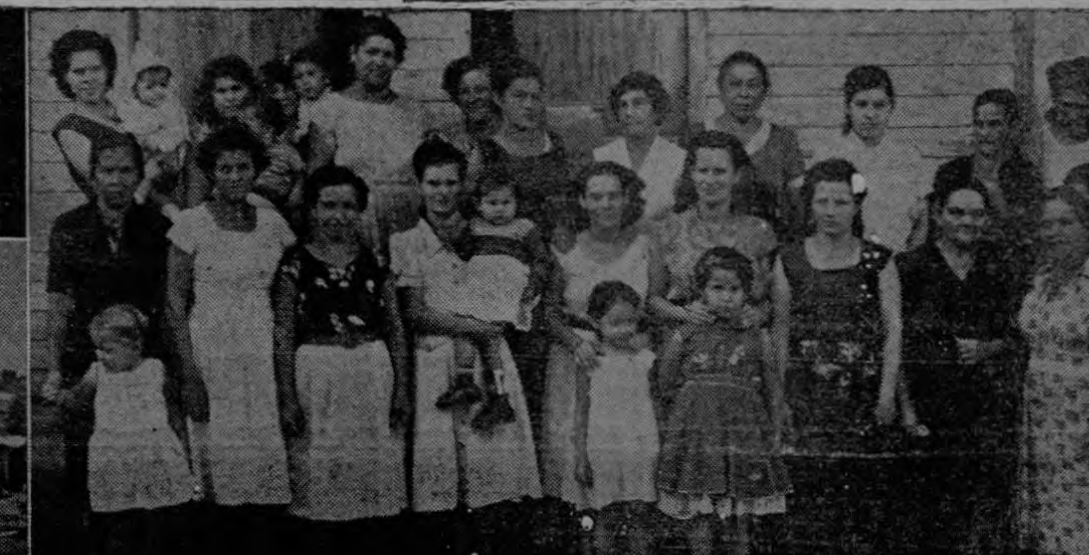
En la gráfica; tres perjudicadas dando la voz de alarma. Luego el grupo entero afectado por la medida, y también las casas que serán desocupadas.—