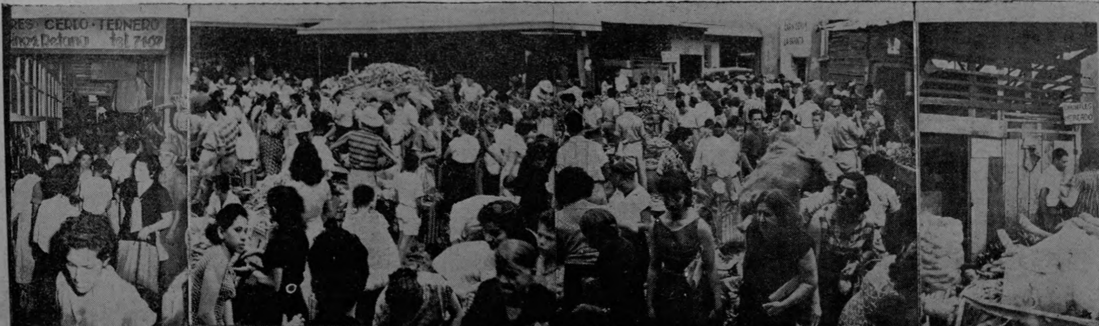
Fotos de Artavia en el Mercado Borbón. 1º—Se aprecia uno de los pasadizos del nuevo pabellón, sumamente reducido e incómodo para un tránsito tan pronunciado. 2º—Patio del Mercado utilizado para la venta de legumbres y otros artículos, antihigiénico por mlt razones, dada que la mercancía es pisada por todo el mundo y está colocada sobre un pavimento sucio. 3º—El famoso "retrete", único en todo el Mercado, y donde cobran un "diez" por cada servicio.

$100.00 metro cuadrado de alquiler por mes.— Un servicio sanitario para 600 personas y $0.10 por usarlo. No hay agua potable.— Patético memorial presentan a la Municipalidad.