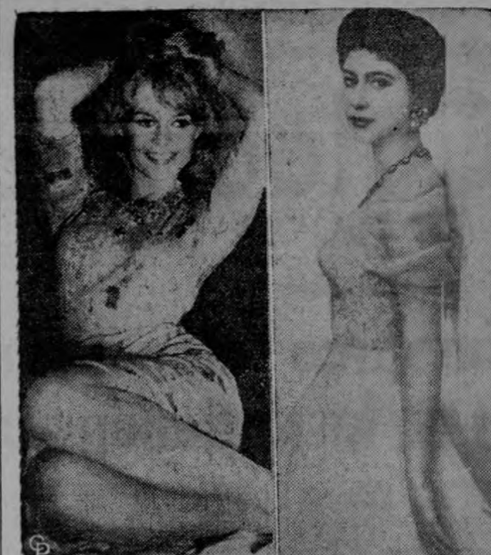
MAS RAPIDA QUE LA BARDOT.—La estrella del cine francés Brigitte Bardot se arregla su pelo en Londres, Inglaterra, después que dijo que perdió una carrera a 80 millas por hora desde el aeropuerto con la Princesa Margarita. La artista francesa, que llegó a Londres para filmar una película, reconoció a la Princesa cuando sus autos se detuvieron ante una luz roja de tránsito. Pero el auto de Margarita anduvo más rápido y dejó atrás a la Bardot.

NINGUNA QUEJA SE ATIENDE Advierten que ninguna queja o protesta de ellos se atiende por parte del propietario. Todo ello hace que la situación de esos inquilinos sea angustiosa. Los precios excesi-