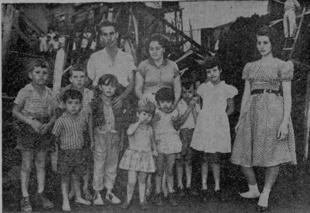
Con el pensamiento en suspenso, afligidos todavía por las pérdidas que les ocasionó el fuego, y dentro de un marco de cenizas y desechos carbonizados, aparecen los damnificados por el incendio en el Barrio Vargas Araya, en Lourdes de Montes de Oca. — Se ha iniciado un movimiento de colecta popular, para ayudarlos. (Artavia)

Dice Chaves que el automóvil en que viajaban varias personas, se le vino encima, semidestrozándole el taxímetro, y cuando él bajó para saber de los daños, los ocupantes del auto huyeron, habían dejado abandonado el vehículo, también deteriorado.