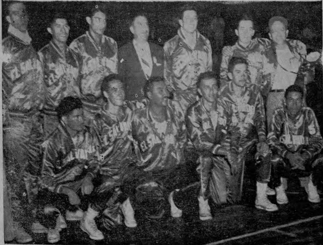
Equipo de basquetbol de El Salvador, quien resu ltó campeón en los recientes Juegos Deportivos Centroamericanos y del Caribe verificados en Caracas, anunciándose oficialmente que también participará en los Terceros Panamericanos con sede en Chicago