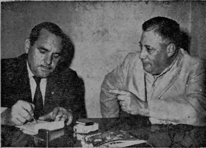
Nuestro fútbol está mal organizado; se disputan campeonatos que no tienen ningún aliciente. La primera División de Ascenso debe desaparecer...