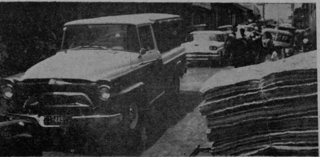
Presas como éstas, congestiones y desorden en el tránsito es lo que ha hecho a 500 automovilistas del Servicio Público pedir la intervención inmediata del Presidente Echandi para que se logre una nueva reglamentación del tránsito