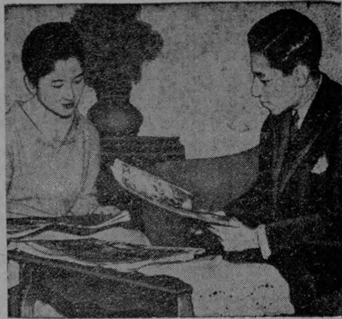
PAREJA IMPERIAL EN SU CASA.—El príncipe heredero de la corona del Japón Akihito y su esposa plebeya la actual princesa Michiko, descansan en la sala de su palacio en Tokio. Su matrimonio rompió 2.619 años de tradición japonesa.

El Ministerio del Interior, entretanto, reiteró que próximamente la Policía Federal dará a conocer próximamente un detallado informe sobre la participación comunista en los desórdenes del tres de abril, en los que se imputa participación a los diplomáticos expulsados. No se indicó, sin embargo, la fecha exacta en que se dará a conocer ese comunicado.