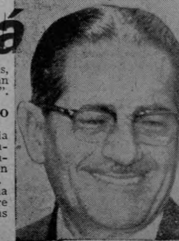
Ernesto de La Guardia