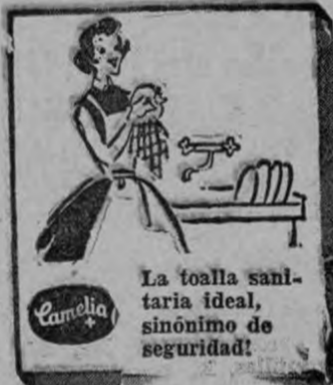
La toalla sanitaria ideal, sinónimo de seguridad!

Expresa el señor Gutiérrez que nuestro país puede llegar a contar con un programa de investigaciones en algodón y que la forma de lograrlo es la de formular un proyecto cooperativo en el que tendrán participación activa aquellas organizaciones directamente interesadas en su cultivo; Ministerio de Agricultura e Industrias, Consejo Nacional de Producción y Cámara de Algodoneros. Los dos primeros organismos han manifestado su conformidad a la idea y habrá próximamente una reunión para darle contenido económico al proyecto.