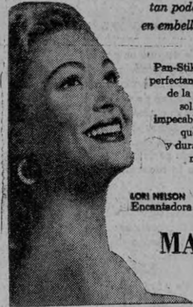
LORI NELSON Encantadora Estrella del Cine

Tan bueno para la piel... tan cómodo y fácil de usar... tan poderoso en embellecer!