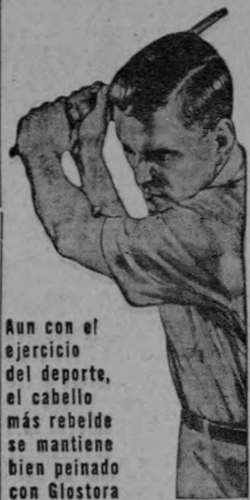
Aun con el ejercicio del deporte, el cabello más rebelde se mantiene bien peinado con Glostora

final de la contienda, suponemos que por lo desigual del score, aflojó su juego en forma visible, de lo que se aprovecharon los nicaragüenses para anotar algunas canastas las que valieron para que el marcador en su contra no fuera del todo tan desastroso. En el partido de anoche, Agencias Aliadas haciendo alarde de su ya bien sentada categoría, se impuso por marcador con veinte de 102 puntos por 50 de los visitantes. Los nicaragüenses de nuevo mostraron mucho entusiasmo y lucharon siempre con denuedo, lo que justifica el considerable número de puntos obtenidos a su favor, si bien es cierto que Agencias Aliadas, en su desesperado esfuerzo por colocar las tres cifras en la pizarra, dedicaron su mayor atención en atacar más que defender. Como siempre Bermúdez fue la figura principal, seguido de Sawyer y Letman, este último a quien le correspondió anotar el punto 100 al cobrar castigo de foul. En esta forma, la serie con los nicaragüenses fue ganada por Costa Rica, fácilmente en forma merecida.