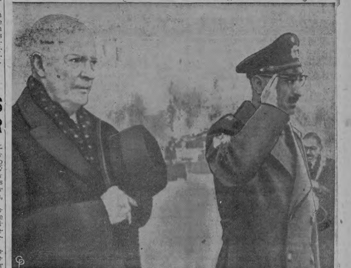
IKE EN AFGANISTAN.—El Presidente Eisenhower, arribando a Kabul, Afganistán, para una visita de cinco horas, se mantiene en posición de atención al lado del Rey Mohammed Zahir, durante las ceremonias de recibimiento. Sus conversaciones con el gobernante de Afganistán concierne a los esfuerzos para mantener ese primitivo pero estratégico país —en la frontera de Rusia— fuera de la órbita soviética. Más tarde Ike se trasladó a Nueva Delhi, India.

Dice "La Tribuna" que, al levantar su voz de protesta, "insta a la prensa del continente y a todos los sectores democráticos, a una acción común para defender la vida de quienes en Paraguay luchan por la libertad".