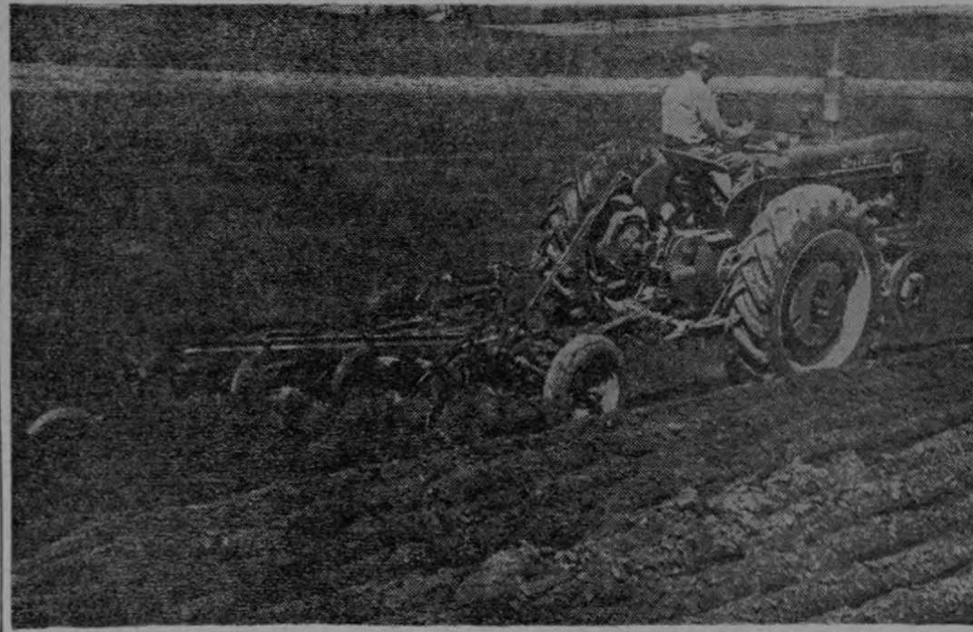
Ejemplo de la formación de prisms bien definidos, continuos y de ángulo correcto, lo cual asegura fragmentación óptima y listos pa-

5) tratamiento prolijo de las frutas durante la cosecha, para descartar la descomposición de las mismas en el trayecto del campo al mercado.