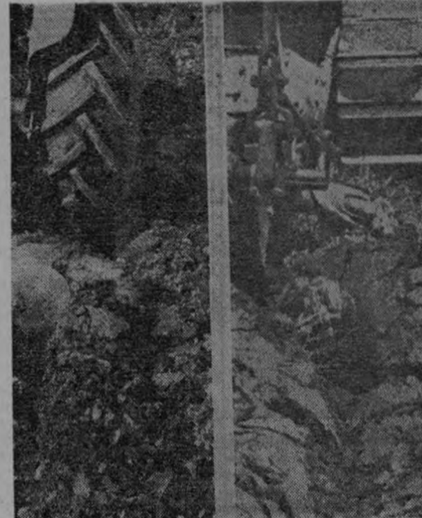
Conveniente: el tamaño y variedad de los terrones es favorable. Inconveniente: la falta de desmoronamiento y aberturas. Los terrones son excesivamente grandes y duros.