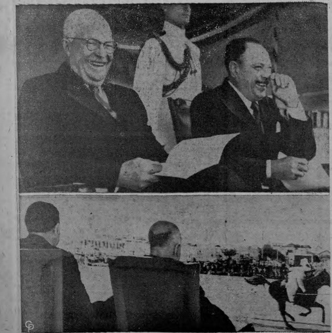
EXHIBICION EN HONOR DE EISENHOWER.—El Presidente Eisenhower y el Presidente de Pakistán, Mohammed Ayub Khan (arriba) com parten una amplia sonrisa durante un desfile de equitación de la guardia montada de Ayub, en Karachi. Abajo, un jinete pasa frente a Eisenhower y Ayub. Más tarde, el Jefe Ejecutivo norteamericano dijo que América continuaría su ayuda económica y militar a Pakistán. La siguiente escala de Eisenhower será Afganistán.

Londres, Dic. 17 (UPI). — El Presidente de Perú, doctor Manuel Prado, y su esposa, harán una visita oficial a Gran Bretaña desde el 24 al 26 de febrero, por invitación del Gobierno Británico. El anuncio, hecho hoy por el Ministerio de Relaciones Exteriores, dice que el jefe del Ejecutivo peruano llegará aquí procedente de Roma, después de visitar esa ciudad.