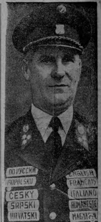
NUEVO PREMIER.—Paul Sauve (arriba), de 52 años, fue escogido para reemplazar al fallecido Maurice Duplessis como Premier Provincial de la Provincia de Quebec, Canadá. Sauve fue Ministro de Juventud y Desarrollo en el gabinete de Duplessis.

Admitió que ve "un rayo de esperanza" en los recientes acontecimientos de la Unión Soviética en dirección a un más libre intercambio de ideas e información con otros pueblos. Aseguró que esto le impulsó a reiterar la propuesta norteamericana de hacer un año de que los rusos dejen de embrollar las transmisiones de radio de los Estados Unidos lo suficiente para permitir al público soviético escuchar el desarrollo de las sesiones de las Naciones Unidas.