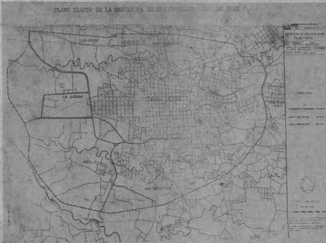
Este es el plano (línea negra punteada) de la vía de circunvalación de San José. Operará como anillo externo para la capital, intercomunicando todas las poblaciones cercanas a la ciudad y descongestionando el tránsito del área metropolitana.

A esa suma asciende el monto de los impuestos y derechos atrasados en su cancelación, por concepto de ventas de café en el mercado internacional. Se trata de la cosecha 1957-1958. — Podrán acogerse sin embargo, a una ley especial. —