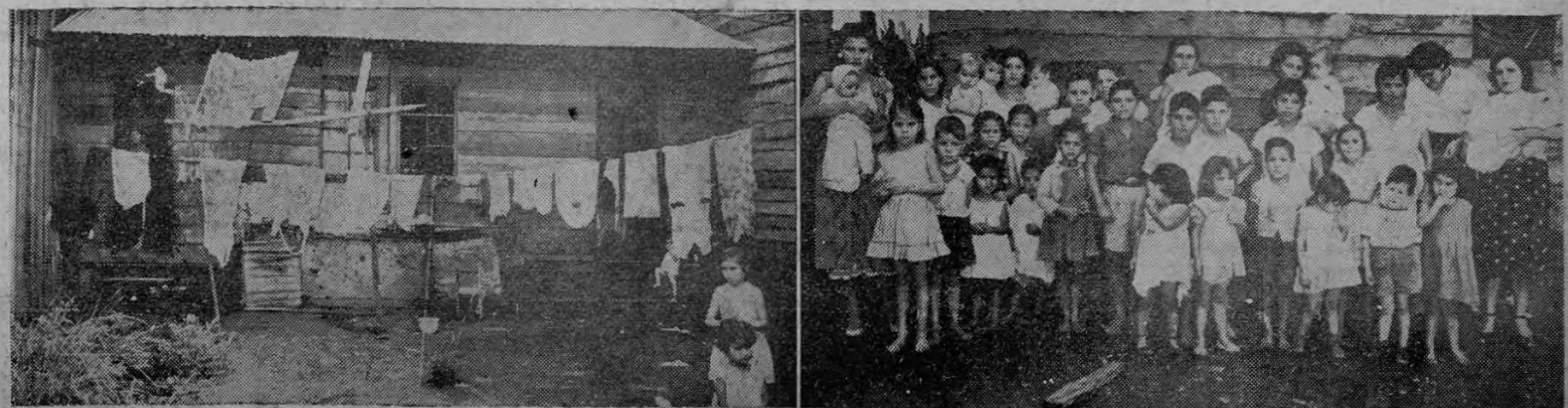
40 niños — muchos de ellos mañana a la calle por el Estado al concluir el plazo fijado en de brazos — 25 adultos y 12 familias en total serán lanzados. — Pasa a la Pág. TRES

Son 40 niños y 25 adultos. — Juicio de desahucio contra inocentes. — Niños con gripe. — Se les obligará a pagar las costas. — Casas levantadas de mala fe. — Los desesperados habían pedido protección de LA VIVIENDA EN MARCHA. —