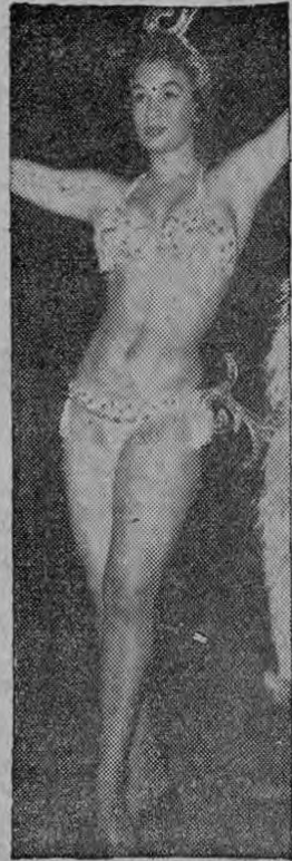
Gloria Normanda el ciclón dominicano

Un derroche de gracia, simpatía, belleza y ritmo.