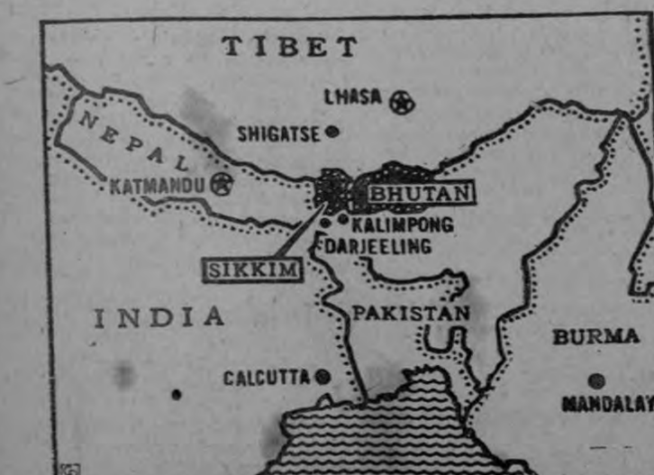
COMUNISTAS INVADEN TERRITORIO DE LA INDIA. — Este mapa muestra el lugar por donde las tropas comunistas chinas invadieron el territorio de la India, capturando un número de puestos fronterizos, según informó el Primer Ministro de la India Jawaharlal Nehru. Se dijo que se peleó justamente bajo el Tibet y los protectorados de Bhutan y Sikkim. Nehru dijo que el ataque sería considerado como una agresión contra India.

Como primera consecuencia de la crisis un grupo de Generales del ejército ha expresado su desacuerdo con el relevo de Toranzo.— Realizan consultas con guarniciones del interior.—