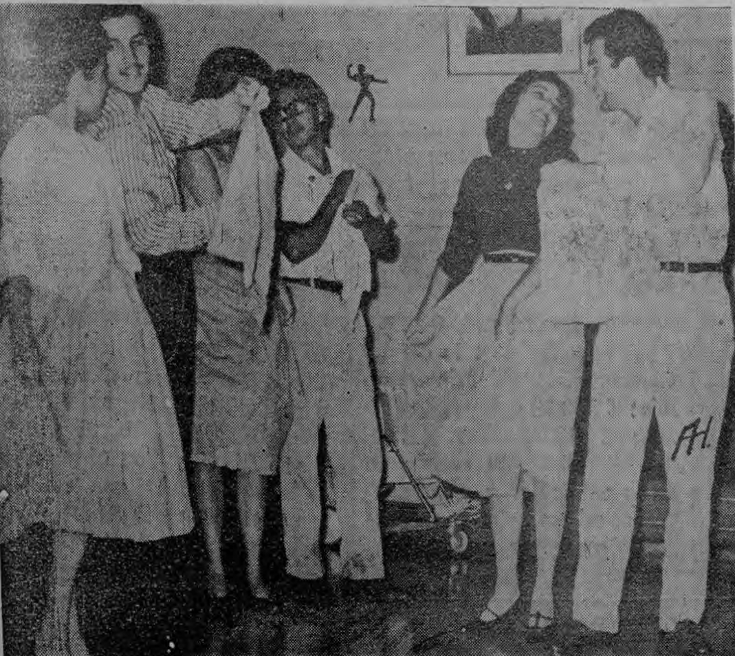
Todos los lunes y viernes los integrantes ensayan en la casa del Director. Aquí los captó Herradora en un paso muy conocido del tradicional y eterno "Punto Guanacasteco"