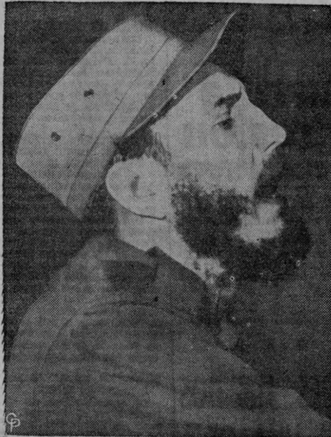
Fidel Castro habla en el Hotel Nacional en La Habana donde declaró que "no me venderé a los norteamericanos, ni recibiré órdenes de ellos". Esto siguió a las críticas en los Estados Unidos a las ejecuciones y juicio por crímenes de guerra contra 631 partidarios de Batista. El líder de los rebeldes cubanos dijo que algunos norteamericanos están "desorientados" por la prensa