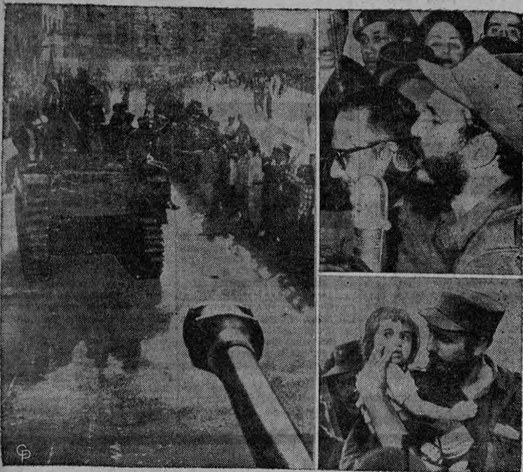
Fidel Castro (arriba, derecha) presenta "nuestros respetos" al Presidente provisional de Cuba Manuel Urrutia que está junto a él en el balcón del Palacio Presidencial en La Habana. Castro dijo a las multitudes que le recibieron a él y a su ejército que "Urrutia puede contar con nuestro apoyo incondicional". Más tarde Castro cargó a un niño (abajo) para darle un beso mientras recorría la capital en un desfile de victoria. A la izquierda, tanques rebeldes pasan ante el pueblo que los ovaciona