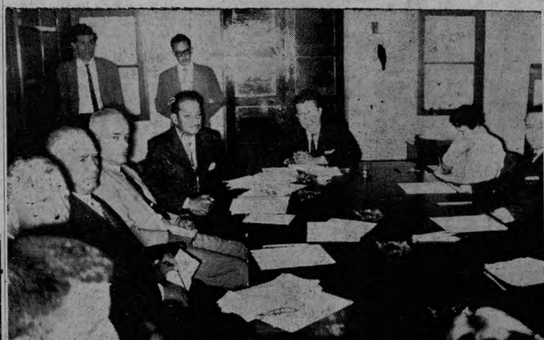
Para estudiar y discutir conjuntamente sus problemas, se reunieron hoy con el Ministro de Gobernación los siete Gobernadores de Provincias.

TEGUCIGALPA, Enero, 20, (UPI).—Un petardo hizo explosión esta madrugada en el edificio donde están instaladas las oficinas de la Procuraduría General de la República, el cual sufrió algunos desperfectos. Se supone que los autores del atentado, hasta ahora desconocidos, lanzaron el artefacto al interior del edificio por una ventana de la planta baja. La detonación sacudió los edificios próximos y causó la consiguiente alarma entre el vecindario del barrio. Las autoridades han iniciado activas pesquisas en busca de los terroristas.