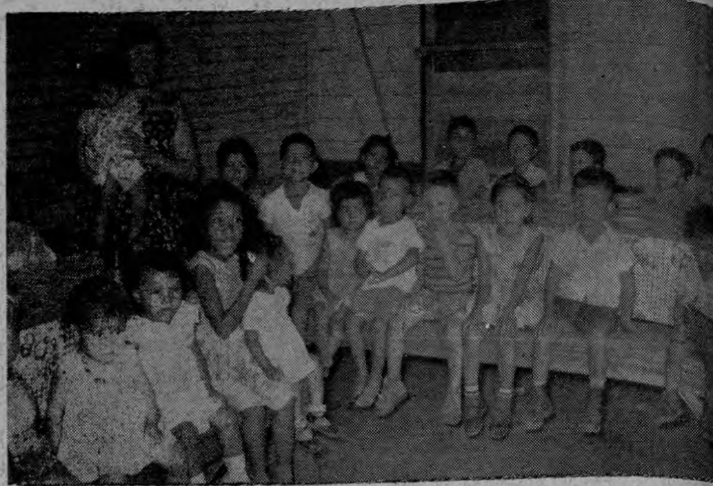
Los niños del Comedor Infantil

El Comedor Infantil de Pantareñas, al igual que muchos otros del país, suspendió sus actividades, dejando sin sus raciones alimenticias a numerosos niños pobres del puerto del Pacífico.