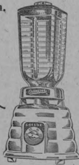
Famosa LICUADORA "OSTERIZER"