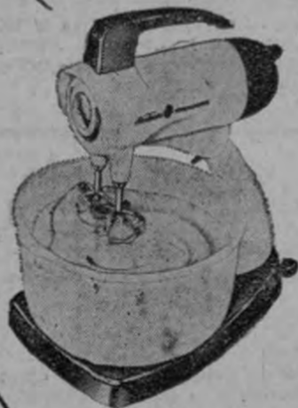
"MIX MASTER" Mezcla, exprime, etc.