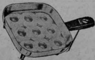
SARTEN, AUTOMATICA. Prepara rápidamente los alimentos.