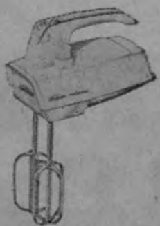
BATIDOR PORTATIL Para queques, cremas, budines, etc.