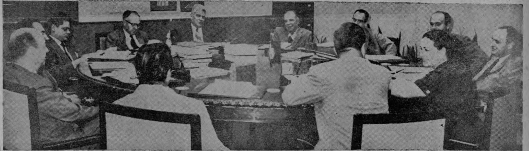
La gráfica de Herradora recoge el momento en que los Directores de la Caja Costarricense de Seguro Social inician el primer debate del trascendente asunto de la libre elección médica. Esta reunión se verificó ayer, en horas de la tarde.—

La Gerencia puso en manos de los miembros Directores, un estudio.— Corresponderá ahora a la Directiva pronunciarse en definitiva.— En futuras sesiones se tramitará este asunto.—