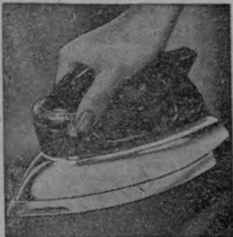
FAMOSA PLANCHA AUTOMATICA. Se calienta en 20 segundos.