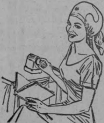
Secador para el cabello. Temperatura graduable. ¡Muy práctico!