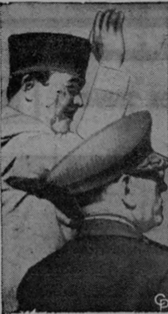
SUKARNO EN BRASIL.— El Presidente Sukarno de Indonesia saluda a la multitud en Río de Janeiro al llegar en una gira de seis días al Brasil. Fue recibido por el Presidente Juscelino Kubitschek para iniciar conversaciones que se espera amplíen los planes de Brasil de desarrollar el comercio y relaciones políticas con Asia meridional. Sukarno también visitará Buenos Aires